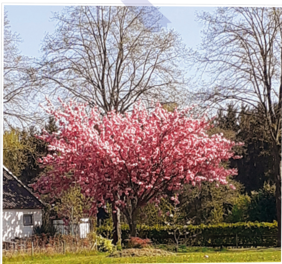
Voorjaar 2022 prachtige boom met bloesem - Ina Dogger ■

Elke week een foto die gemaakt is in onze gemeente. Hebt u een mooie foto voor deze rubriek? Mail die naar: communicatie@twenterand.nl .