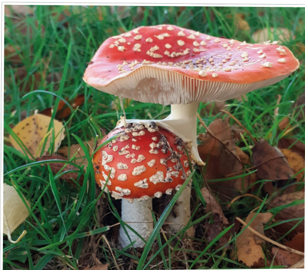
De herfst is begonnen - Ina Dogger ■

Elke week een foto die gemaakt is in onze gemeente. Hebt u een mooie foto voor deze rubriek? Mail die naar: communicatie@twenterand.nl .