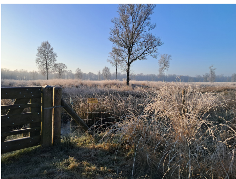
Zaterdagochtend in de vrieskou aan het Hazenpad, Veenschap.

Elke week een foto die gemaakt is in onze gemeente. Heeft u een mooie foto voor deze rubriek? Mail die naar ons via communicatie@twenterand.nl .