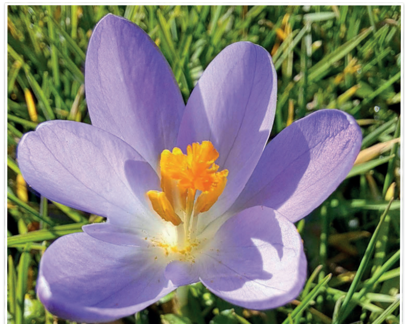
Krokus straalt in de ochtendzon in Vroomshoop.

Elke week een foto die gemaakt is in onze gemeente. Heeft u een mooie foto voor deze rubriek? Mail die naar ons via communicatie@twenterand.nl .