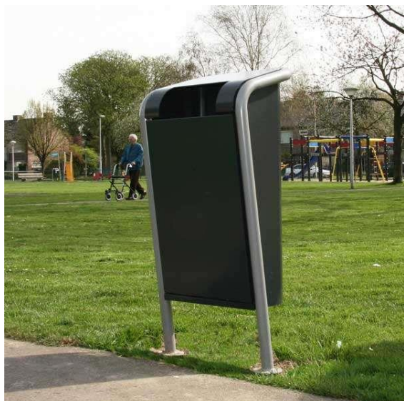
Figuur 1: Openbare prullenbakken

De gemeente Twenterand heeft geen speciale prullenbakken voor hondenpoep. Hondenpoepzakjes dienen dus in de reguliere prullenbakken te worden gegooid. Figuur 1 laat de meest voorkomende openbare prullenbakken zien in de gemeente Twenterand.