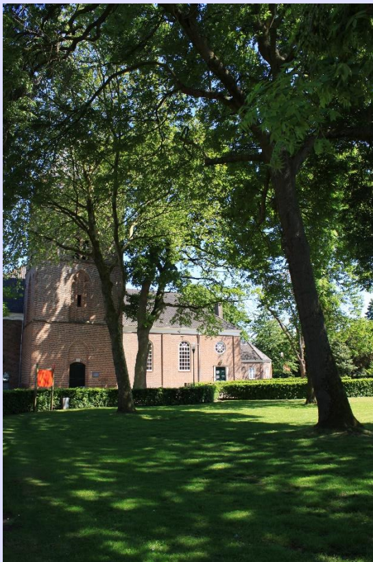
Kerk Den Ham

Aangenomen wordt dat de parochiekerk gebouwd is in de periode 1325-1400. In een oorkonde, gedateerd 5 juni 1412, wordt gesproken van de Onze Lieve Vrouwenkerk in Den Ham. Hoogstwaarschijnlijk was Den Ham in 1397 al een afzonderlijk kerspel met een eigen parochiekerk.