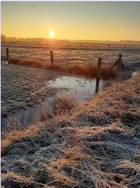
Winter Veenschapsweg

In het hart van Overijssel ligt Twenterand. Een groene gemeente met 108 km 2 aan unieke natuurgebieden, open landschappen, schitterende bossen en levendige woonkernen. De gemeente kenmerkt zich door haar landelijke openheid, agrarische veen karakter en de grote hoeveelheid bebossing en natuurlijke gebieden. Twenterand telt 34.000 inwoners die wonen in vijf kernen, Den Ham, Geerdijk, Vroomhoop, Westerhaar-Vriezenveensewijk en Vriezenveen. Daarnaast kent de gemeente de buurtschappen Bruinehaar, De Pollen, Weitmanslanden en Westerhoeven en heeft het een groot buitengebied.