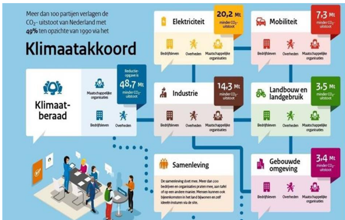
Figuur 2: klimaatakkoord en de opgave voor 2030 in een oogopslag

In bijlage 1 zijn de verslagen van de werkconferenties van 9 januari 2020 en 5 maart 2020 opgenomen. In bijlage 2 is een lijst met geraadpleegde stukken en geïnterviewde personen opgenomen. Deze vormen de basis voor deze rapportage. Verslagen van de interviews zijn in het bezit van de rekenkamercommissies en maken deel uit van het onderzoeksdossier. Omwille van vertrouwelijkheid zijn de verslagen niet opgenomen in het rapport.