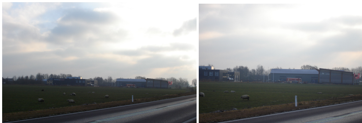
Figuur 1a en 1b: Huidig aanzicht van Aldtsjerk vanaf provinciale weg vanuit Dokkum

Het hart van het plan vormt een nieuw meer van ca. 5 ha dat in open verbinding staat met de Aldtsjerker Feart. Dit meer wordt de actieve variant op de Aldtsjerker Mar dat aan de andere zijde van het dorp in het natuurgebied van het Fryske Gea ligt. Rond dit nieuwe meer worden smalle bospercelen aangelegd met wandelpaden. Dit bos onttrekt het bestaande industriegebied aan het zicht voor verkeer vanaf Dokkum. Vanaf deze zijde krijgt Aldtsjerk weer het aanzicht dat de Wouden kenmerkt.