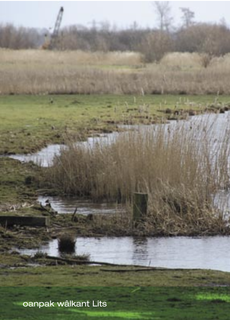
oanpak wâlkant Lits