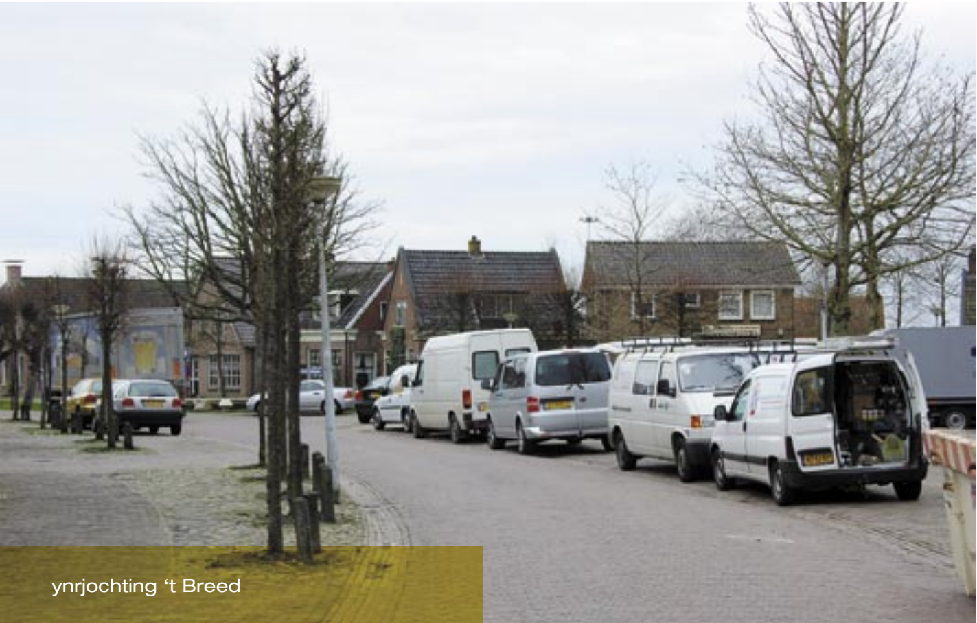
ynrjochting 't Breed