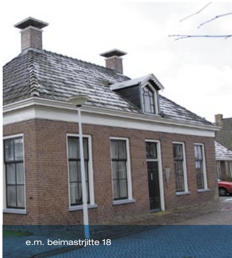
e.m. beimastrjitte 18