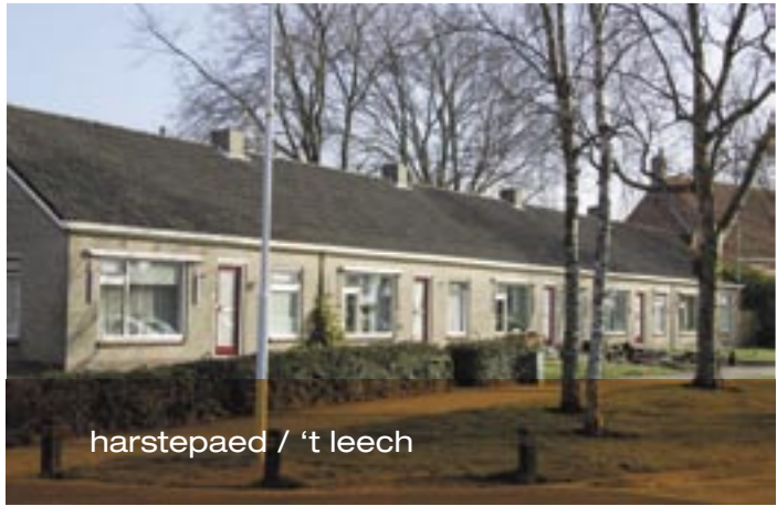
harstepad / 't leech