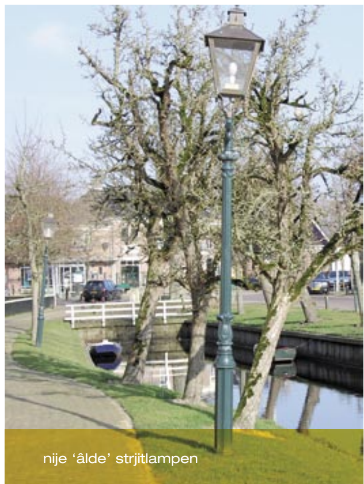
nije 'âlde' strjitlampen