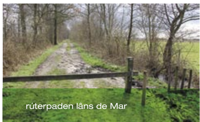
rúterpaden lâns de Mar