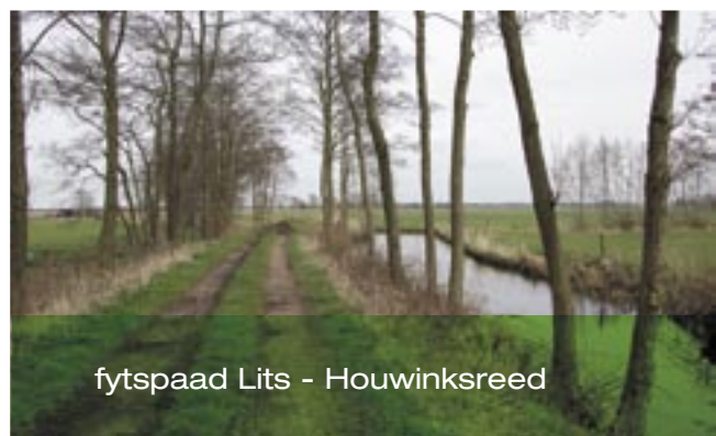
fytspaad Lits - Houwinksreed