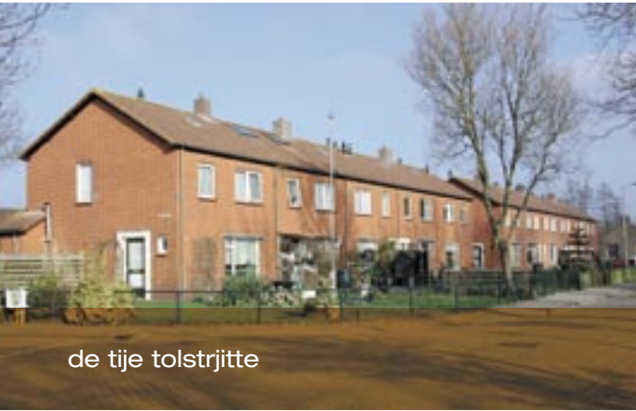
de tije tolstrjitte