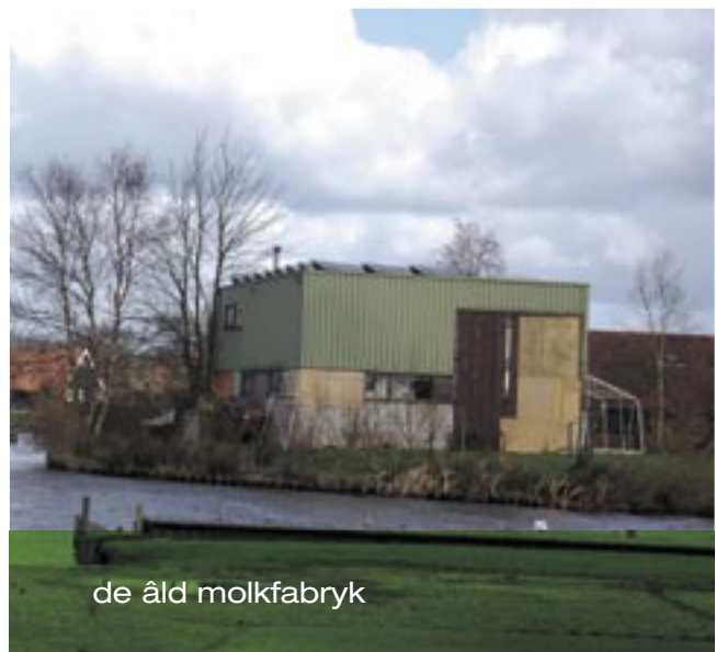
de âld molkfabryk