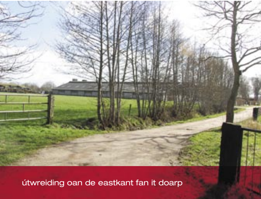
útwreiding oan de eastkant fan it doarp