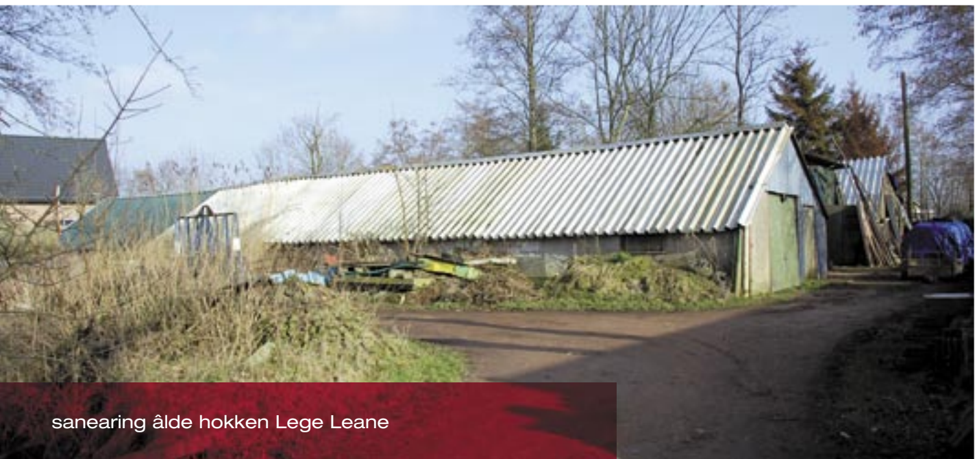
sanearing âlde hokken Lege Leane