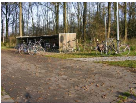
Omgeving bushalte Siegerswâld

Hetzelfde geldt ook voor het Skoallepaadsje tussen de Greate Buorren en Lubwei en het Tennispaadsje en het gedeelte Brandsmaloane-I.Boonstraloane buiten de bebouwde kom. Het voetpad Mounehoek – Ljippenstâl is aardedonker omdat de enige lantaarnpaal in de hulst is verscholen.