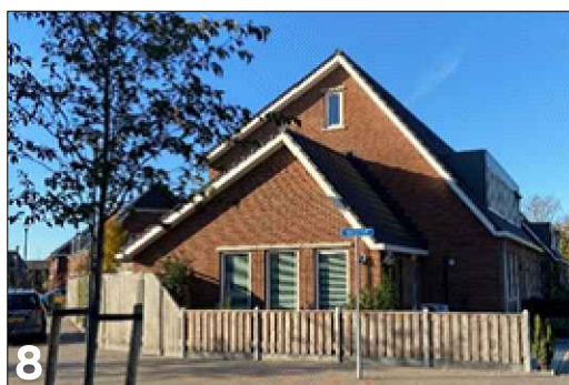
8 Aandacht voor hoekoplossing door de toepassing van een opbouw op het bijbehorend bouwwerk en open gevelcompositie