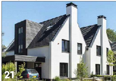
21 Twee-onder-een-kap woning met een haakse dakoriëntatie