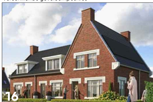
16 Accentuering van een vierkante gevelgeleding