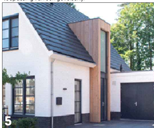
5 Aandacht voor hoekoplossing door de toepassing van een risaliet in het hoofdgebouw met afwijkende materiaalsoort