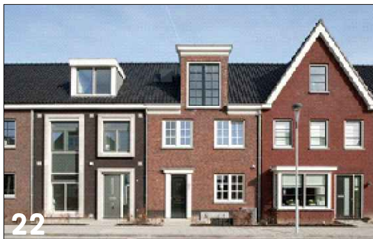
22 Rijwoningen met een langskap (zadeldaken) en ondergeschikte gevel opbouwen