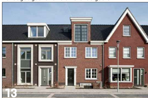
13 Vierkante gevelgeleding met toepassing van verschillende gevelcomposities