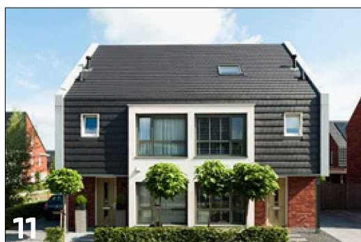
11 Vierkante gevelgeleding met toepassing van een verlaagde goot en divers materiaalgebruik