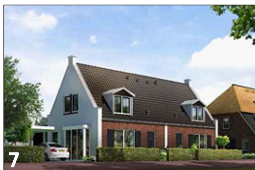
7 Aandacht voor hoekoplossing door de toepassing van afwijkend gevelmateriaal en kleine erker