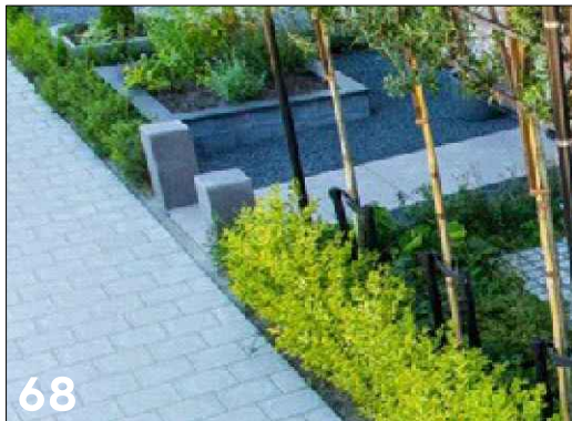
Lage groene erfafscheiding