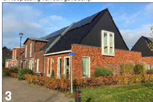
3 Verbijzondering zijgevel d.m.v. textuurverschil en toepassing van een gevelschijf