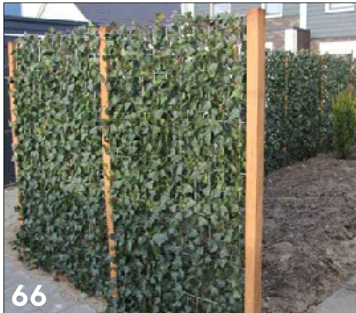
Hoge groene erfafscheiding