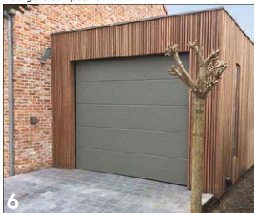
6 Extra accent door materiaalverschil tussen hoofdgebouw en bijbehorend bouwwerk