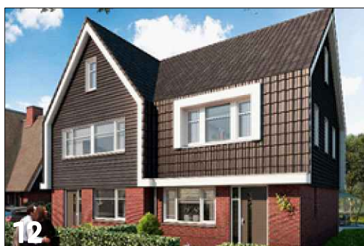
12 Verspringen van de rooilijn en verlaging van gootlijn