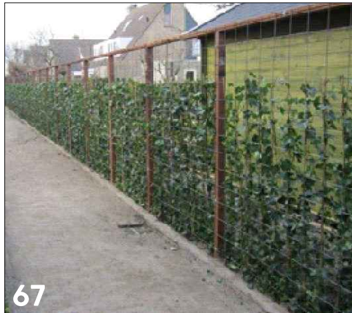
Hoge groene erfafscheiding