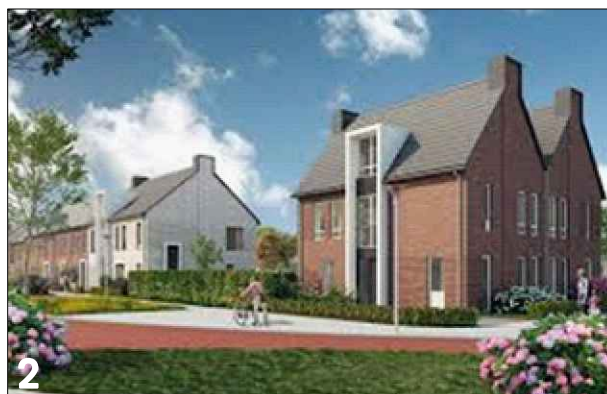
2 Verbijzondering zijgevel d.m.v. toepassing van een risaliet