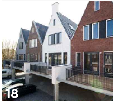
18 Ontsluiting van wooneenheden op verdieping aan achterzijde complex