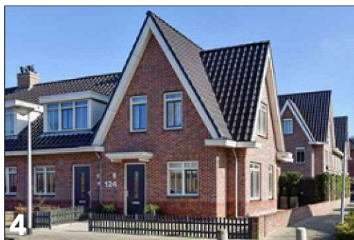
4 Verbijzondering zijgevel d.m.v. toepassing van een voorgevelcompositie