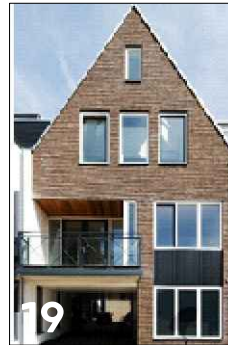
19 Inpandige verbinding structuur