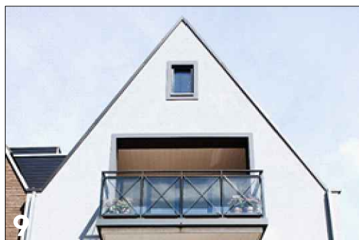
9 Vierkante geleiding binnen de toepassing van het balkon