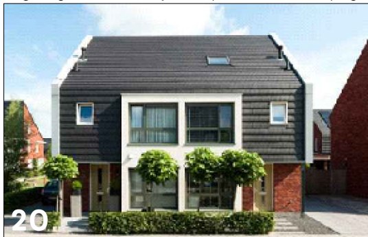
20 Twee-onder-een-kap met een langskap (mansardedak)