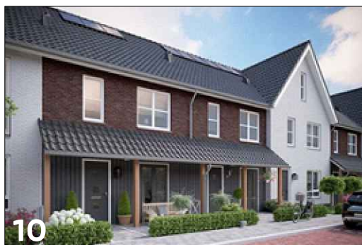
10 Vierkante geleiding binnen het raamoppervlakte