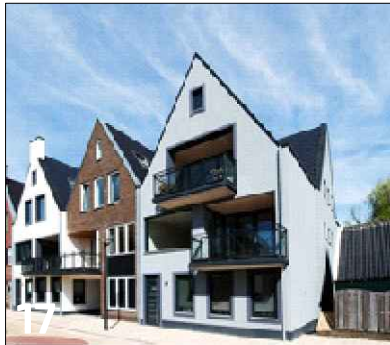
17 Ontsluiting van wooneenheden op begane grond aan voorzijde complex