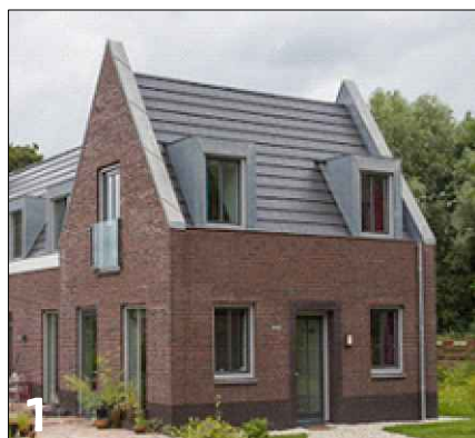
1 Verbijzondering zijgevel d.m.v. textuurverschil en toepassing van een gevelschijf