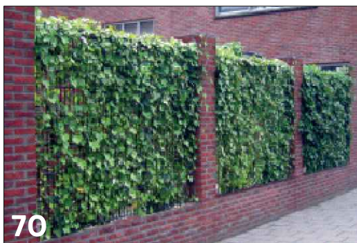
Hoogwaardige erfafscheiding waarbij metselwerk en groen gecombineerd is