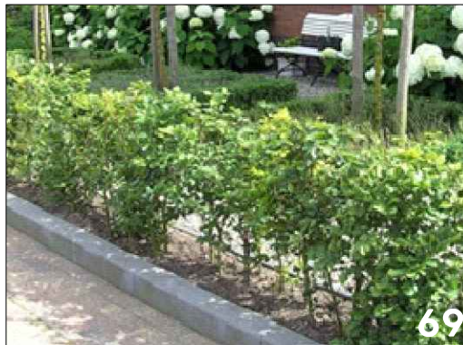
Lage groene erfafscheiding