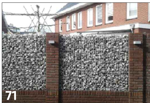
Hoogwaardige erfafscheiding waarbij metselwerk gecombineerd wordt met steenkorf