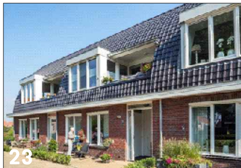
23 Rijwoningen met een langskap met inpandige loggia's (boog)