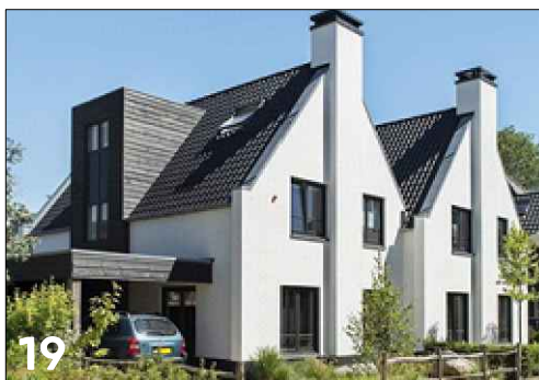
Twee-onder-een-kap woning met een haakse dakoriëntatie