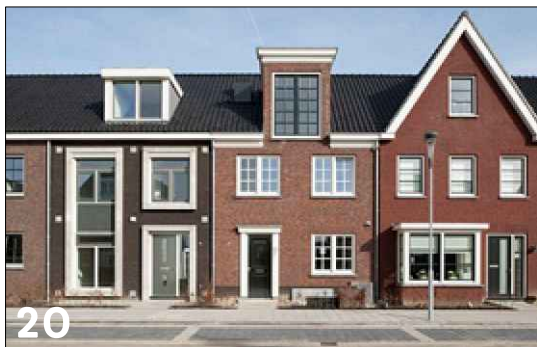
Rijwoningen met een langskap (zadeldaken) en ondergeschikte gevel opbouwen