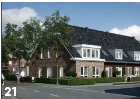
Rijwoningen met een langskap (wolfsdak)