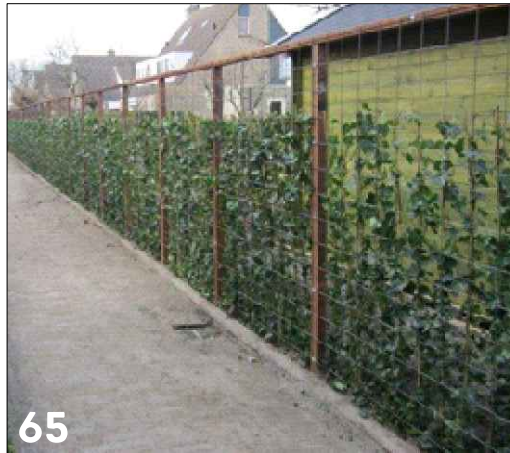
Hoge groene erfafscheiding