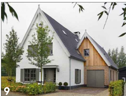
Vierkante gevelgeleding met toepassing van verschillend gevelmateriaal (stuc, hout en metselwerk)