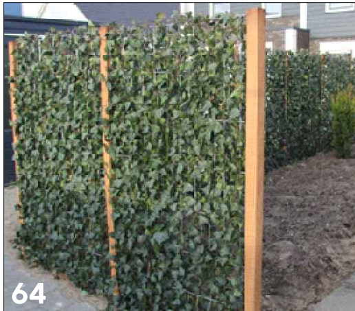
Hoge groene erfafscheiding