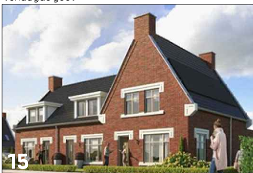
Accentuering van een vierkante gevelgeleding