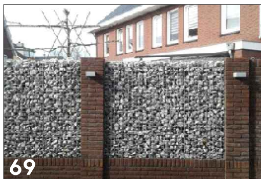
Hoogwaardige erfafscheiding waarbij metselwerk gecombineerd wordt met steenkorf