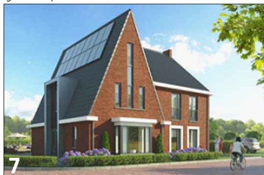
7 Verbijzondering zijgevel d.m.v. toepassing van een risaliet in het hoofdgebouw met afwijkend materiaalgebruik