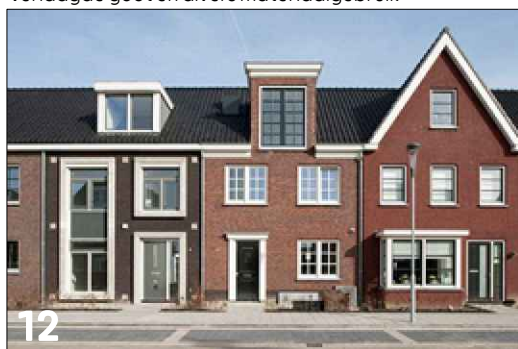
Vierkante gevelgeleding met toepassing van verschillende gevelcomposities