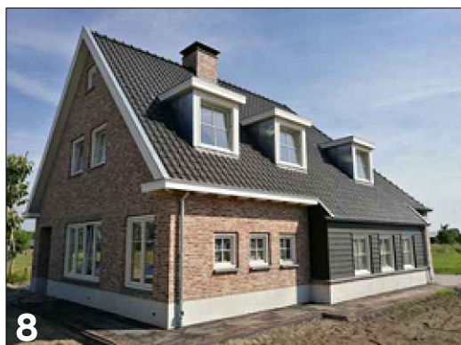
Vierkante gevelgeleding met toepassing van divers gevelmateriaal (stuc, hout en metselwerk)