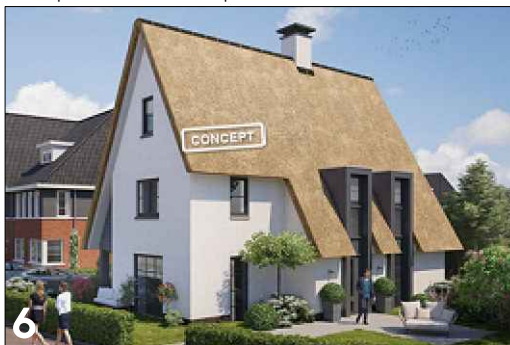
6 Aandacht voor hoekoplossing door de toepassing van een opbouw met doorlopende dakconstructie