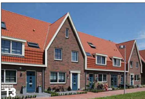
Vierkante gevelgeleding met toepassing van een verlaagde goot