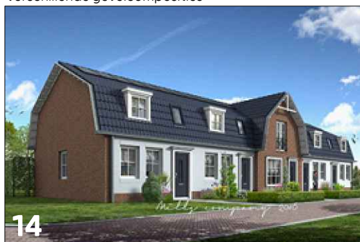
Vierkante gevelgeleding met toepassing van sprong in voorgevel rooilijn en verlaagde goot