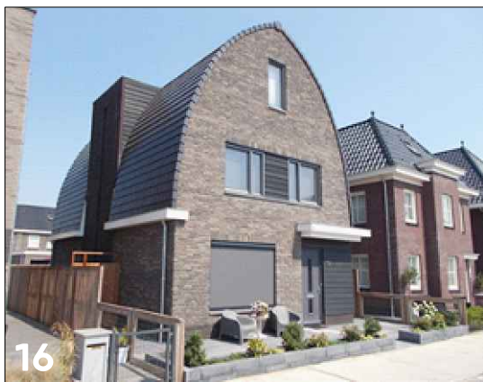
Vrijstaande woning met haakse dakoriëntatie (boogdak)