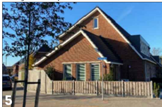
5 Aandacht voor hoekoplossing door de toepassing van een opbouw op het bijbehorend bouwwerk en open gevelcompositie