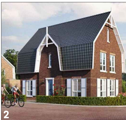
2 Verbijzondering zijgevel d.m.v. toepassing van een voorgevelcompositie