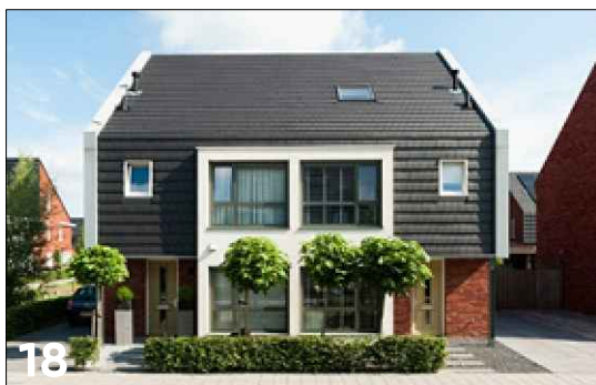
Twee-onder-een-kap met een langskap (mansardedak)