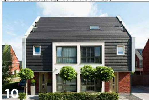
Vierkante gevelgeleding met toepassing van een verlaagde goot en divers materiaalgebruik