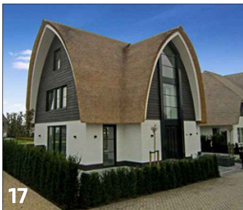
Vrijstaande woning met tweezijdige dakoriëntatie (boogdak)