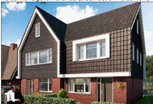
Verspringen van de rooilijn en verlaging van gootlijn