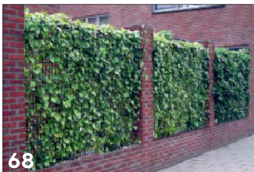
Hoogwaardige erfafscheiding waarbij metselwerk en groen gecombineerd is