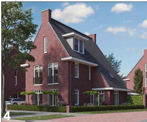
4 Aandacht voor hoekoplossing door de toepassing van een opbouw met doorlopende dakconstructie