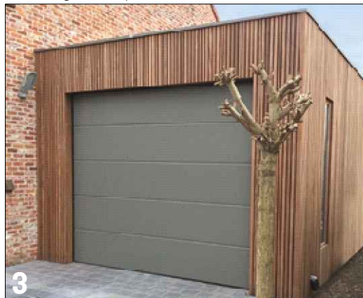
3 Extra accent door materiaalverschil tussen hoofdgebouw en bijbehorend bouwwerk