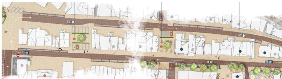
Figuur 2: Voorgestelde éénrichting Raadhuisstraat - Prins Hendrikstraat (uitsnede uit: "HET HART VAN 'HET OUDE DORP' – conceptplan BIZ)

5) Éénrichting verkeer instellen rondom Raadhuisstraat - Prins Hendrikstraat. Ingreep die eigenlijk voortborduurt op deel van huidige situatie: Raadhuisstraat is deels al éénrichting. Volledig éénrichting draagt bij aan verkeersveiligheid en begaanbaarheid. Dit idee is overigens ook geopperd door de BIZ in hun toekomstvisie. Het houdt in dat men de Raadhuisstraat alleen vanaf de Boni kan inrijden en via de Prins Hendrikstraat men terug rijdt.