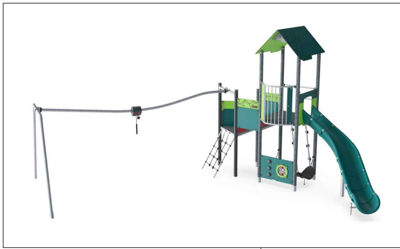
Speeltoren met track ride