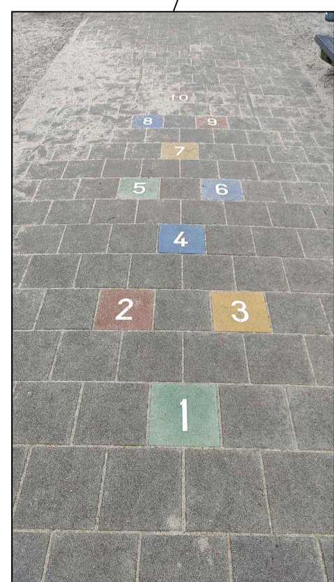
Bestaande hink stap sprong