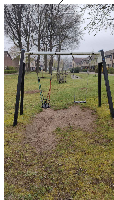
Bestaande schommel Grasversterkingsmatten aanbrengen