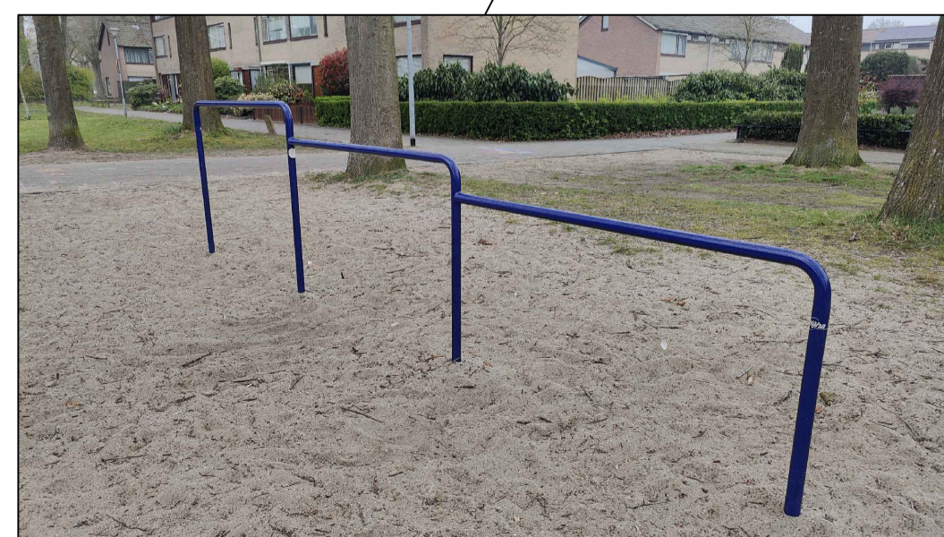
Bestaande duikelrek verplaatst