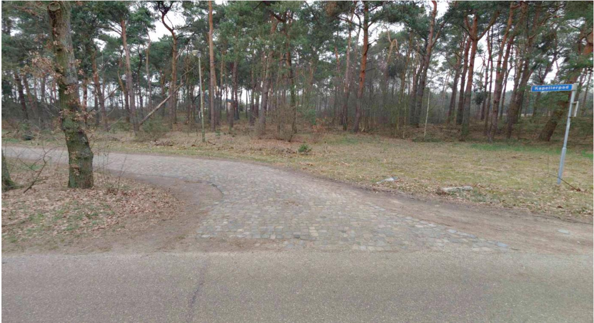
Aansluiting Kapellerpad met Hoeverdijk. Gezien vanaf de Hoeverdijk (2018).