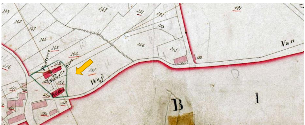
Twee kadastrale kaarten uit 1832. Op de bovenste kaart staat de Kapellerpad aangeduid als 'Weg Borkel naar Schaft'. Op de onderste kaart de vervallen kerk en R.C. Kerk.