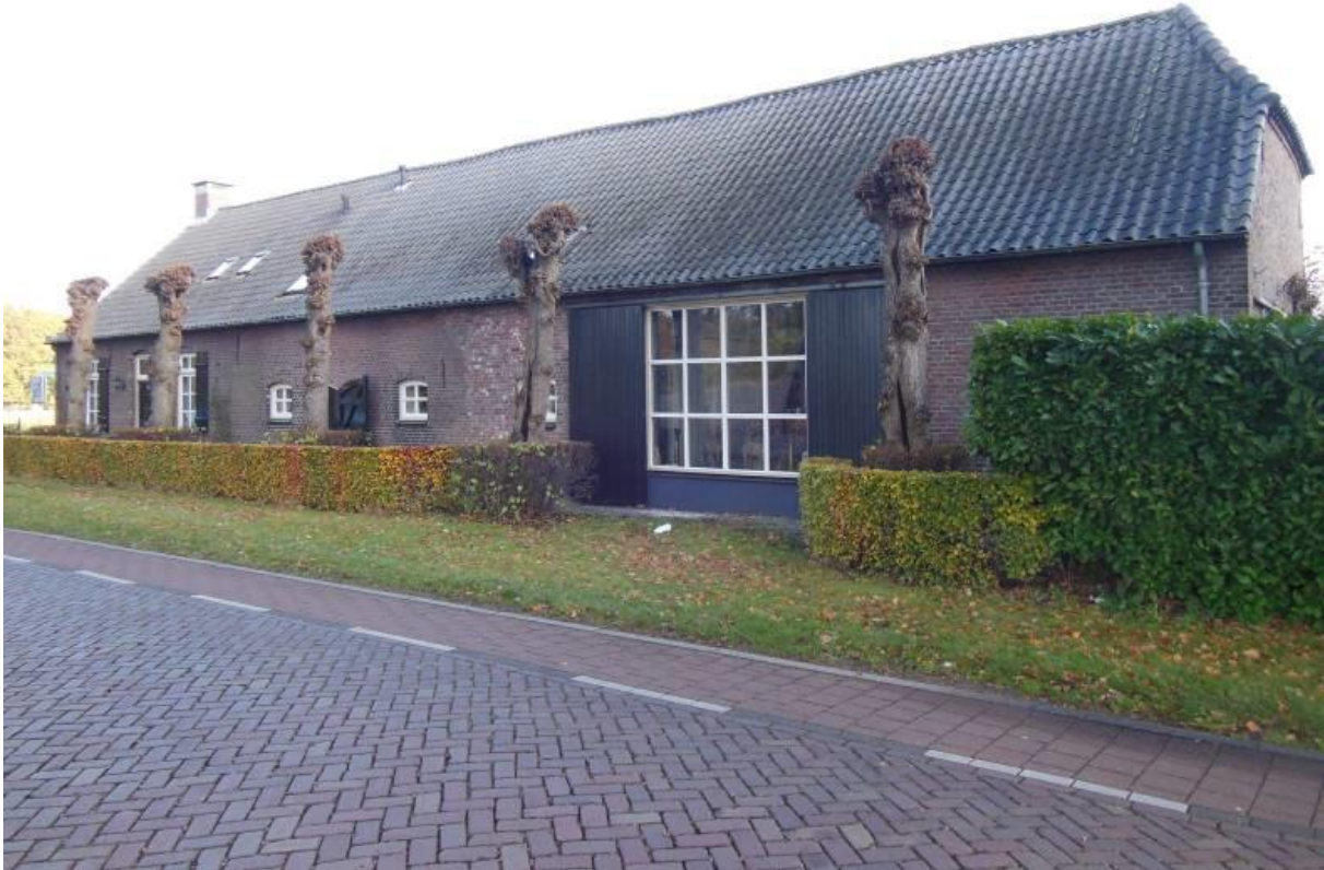
Langgevelboerderij uit 1908 onder zadeldak met wolfseind.

Westelijke voorgevel opgetrokken in schoon metselwerk van rode baksteen in kruisverband. Donker geschilderde gepleisterde plint. Op diverse plaatsen in de voorgevel is het metselwerk vernieuwd. Linkerdeel van de gevel met het woongedeelte, met een centrale houten tweepaneels voordeur met klein enkelruits kijkvenster boven een hardstenen drempel. Metalen deurklopper in de vorm van een mensenhoofd. Enkelruits bovenlicht met kathedraalglas. Hierachter, aan de binnenzijde, een levensboom. Boogveld met daarboven een steense segmentboog. Links en rechts van de voordeur een zesruits venster met tweeruits bovenraam. Houten luiken. Lekdorpel van donkere, geglaazuurde, hardgebakken tegels. Boogveld met daarboven een steense segmentboog, zoals boven de voordeur. Uiterst links in de gevel een zinken regenpijp.