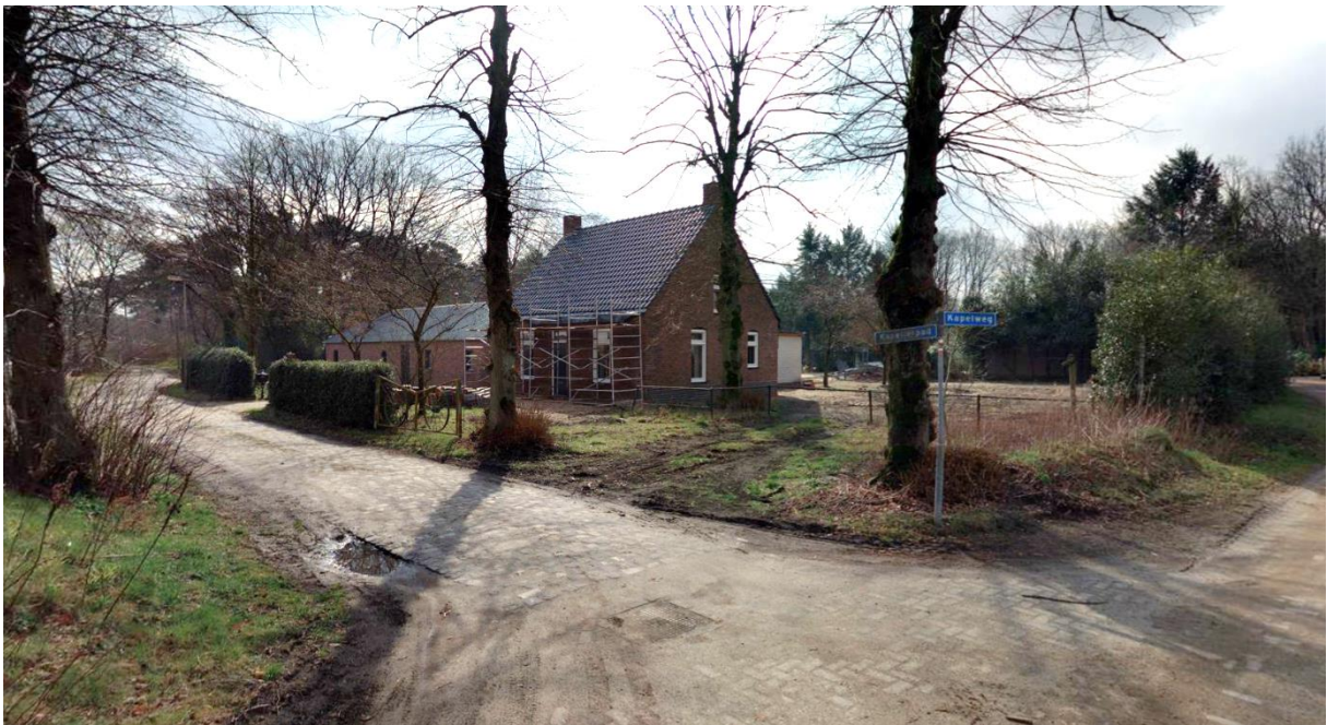
Aansluiting Kapellerpad met Kapelweg. Gezien vanaf Kapelweg (2018).