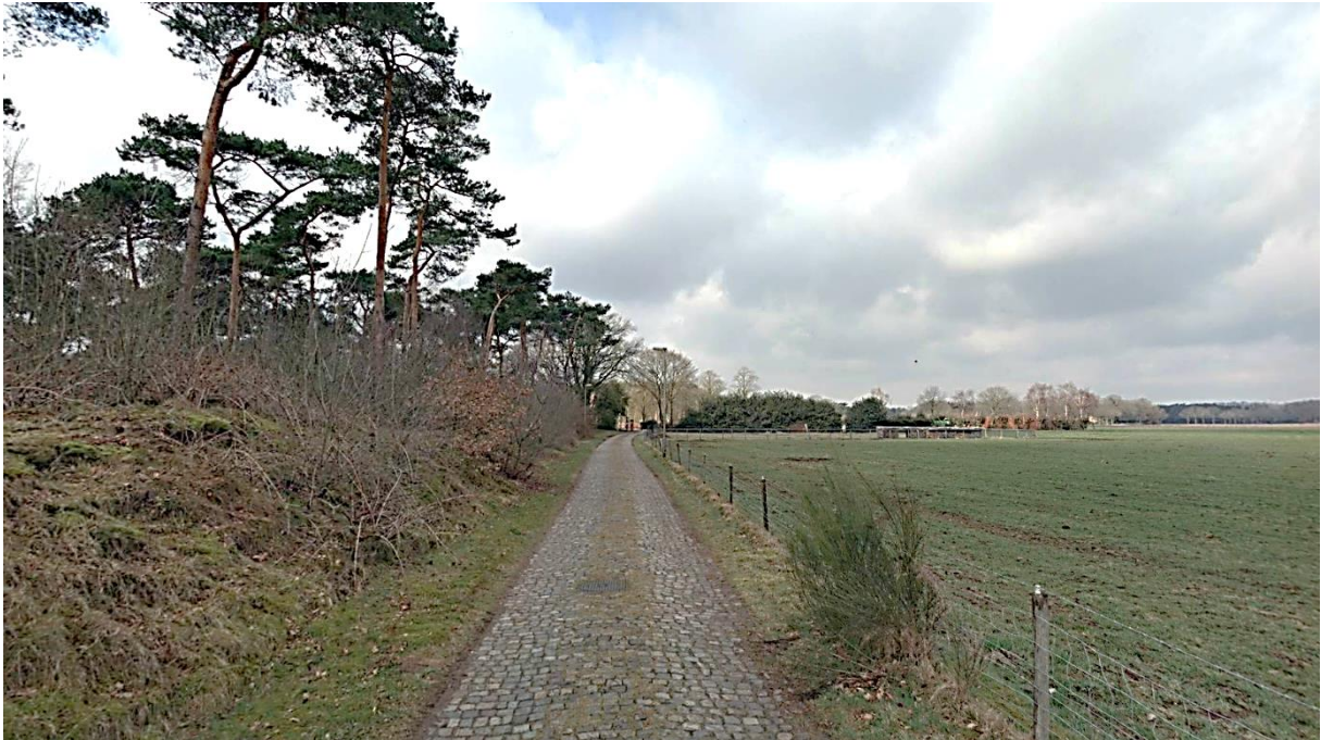
Kapellerpad t.h.v. weiland. met straatkolk (2018).