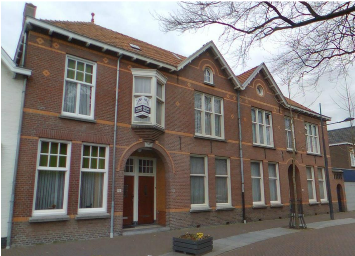
Karel Mollenstraat Zuid 9 en 9A