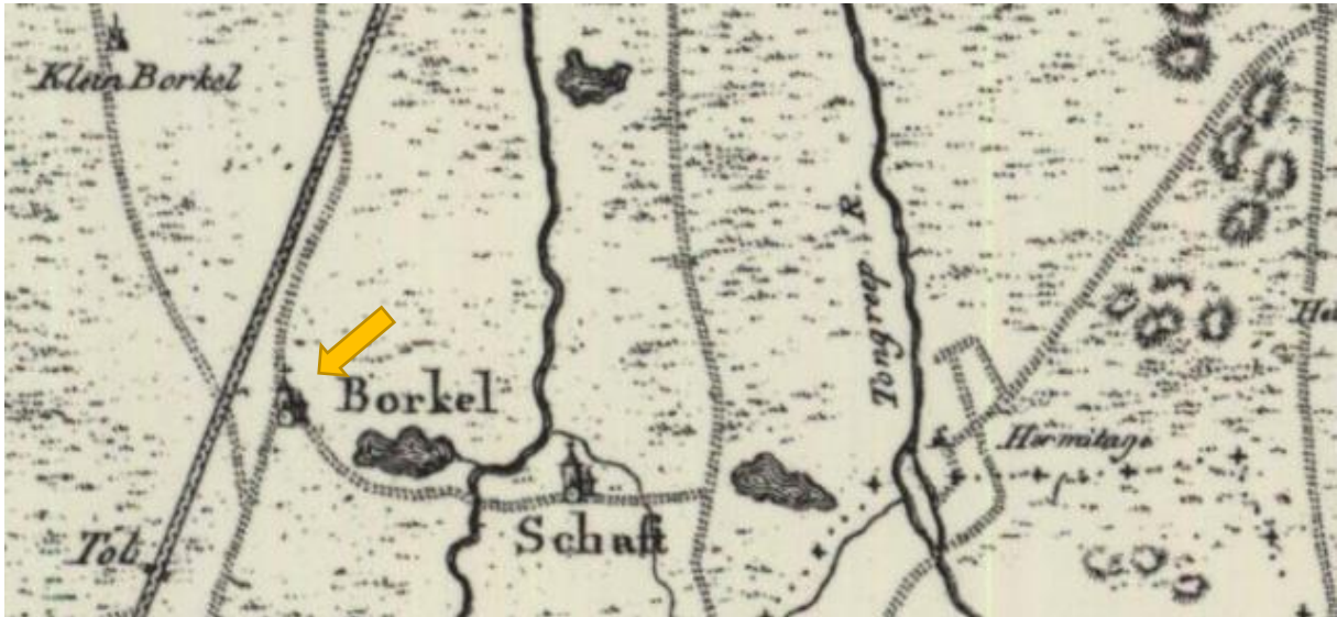
Kaart rond 1815. Bij de gele pijl staat de Kapel/kerk.

Borkel is een voorbeeld van een krans-akker-dorp gelegen rondom de Strater Akkers. De boerderijen stonden met hun "voordeur" op de rand van het akkergebied. In 1830 lag het gehucht Borkel aan de oost en zuidzijde van genoemde akkers. Het huidige centrum van Borkel is pas ontstaan na 1845 bij het gereedkomen van de gemeenschappelijke Sint Servatius kerk voor Borkel en Schaft.