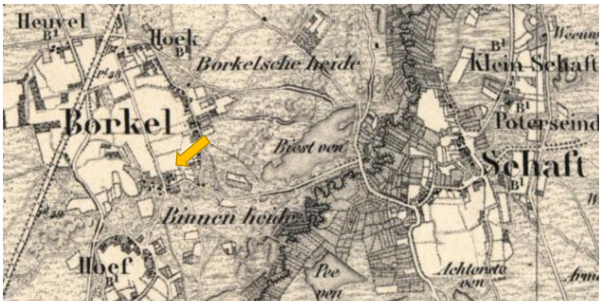
Topografische militaire kaart. Verkend 1837, gegraveerd 1863, gedrukt 1888. Bij de gele pijl staat de Kapel.