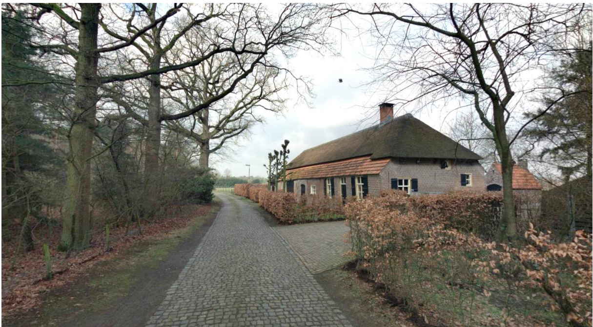
Kapellerpad t.h.v. Kapellerpad 8 met aansluiting op uitrit (2018).