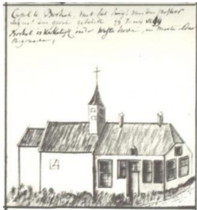
De kapel Borkel naar Verhees

Na de restitutie van de kerken in 1798 bleef de schuurkerk in gebruik. Vermoedelijk werd er vanaf dat moment, maar in elk geval vóór 1805, een kerkhof aangelegd. Het begraafboek van de pastoor opent op 22 maart 1805 met de begrafenis van Maria Catharina Snellens en sluit op 29 maart 1845 met de begrafenis van Maria van Geest. Het kerkhof is vanaf dat moment niet meer gebruikt omdat er bij de nieuwe gezamenlijke kerk, die in 1845 in gebruik werd genomen, ook een nieuw kerkhof werd aangelegd.