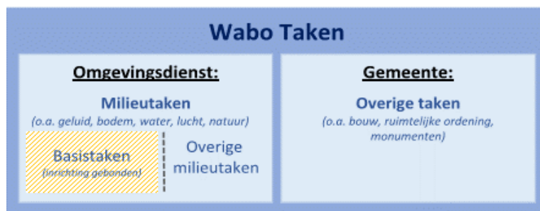
Figuur 1 Overzicht reikwijdte beleid

De Wabo maakt bij het vaststellen van uitvoerings- en handhavingsbeleid onderscheid in beleid voor basistaken en niet-basistaken. Een groot deel van de milieutaken die een omgevingsdienst onder verantwoordelijkheid van de gemeente moet uitvoeren zijn verplichte basistaken.