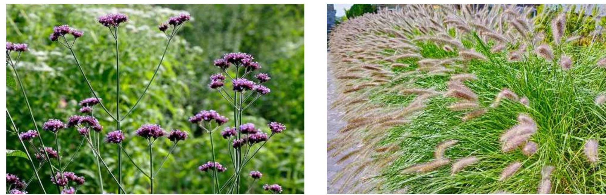
Verbena bonariensis Pennisetum alopecuroides