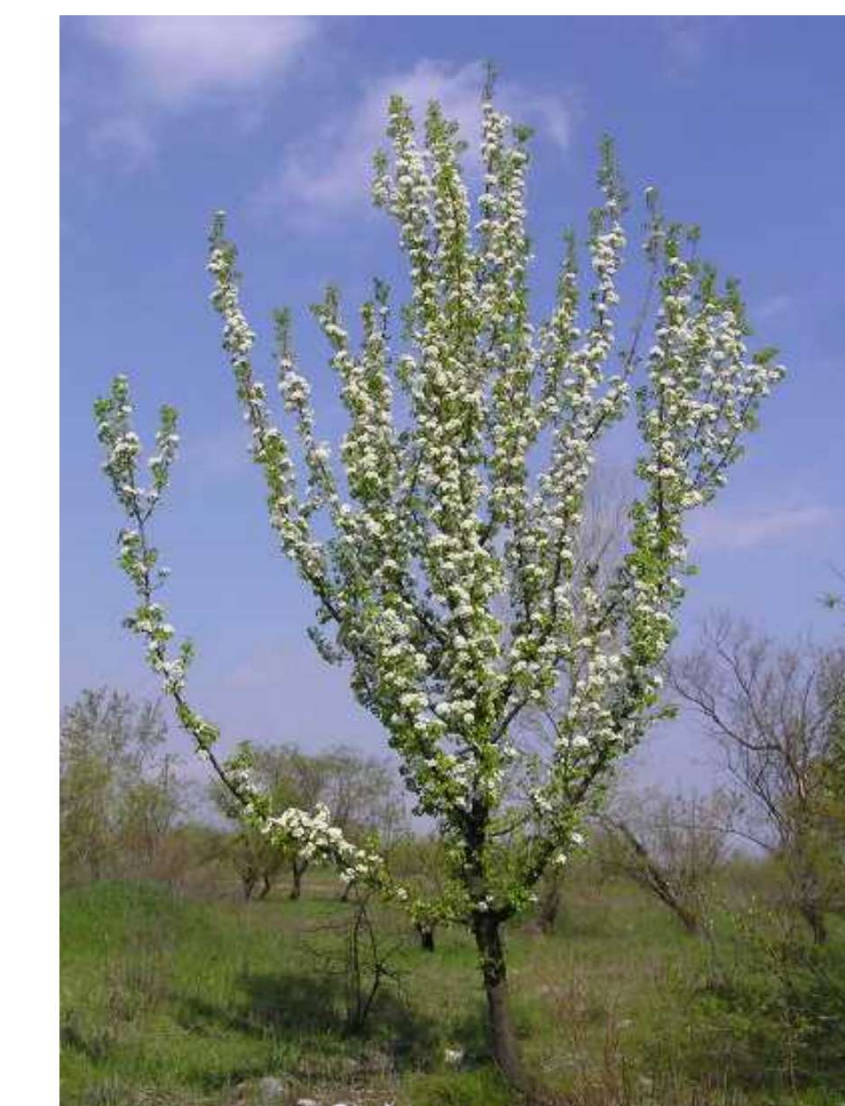
Pyrus communis 'Conference'