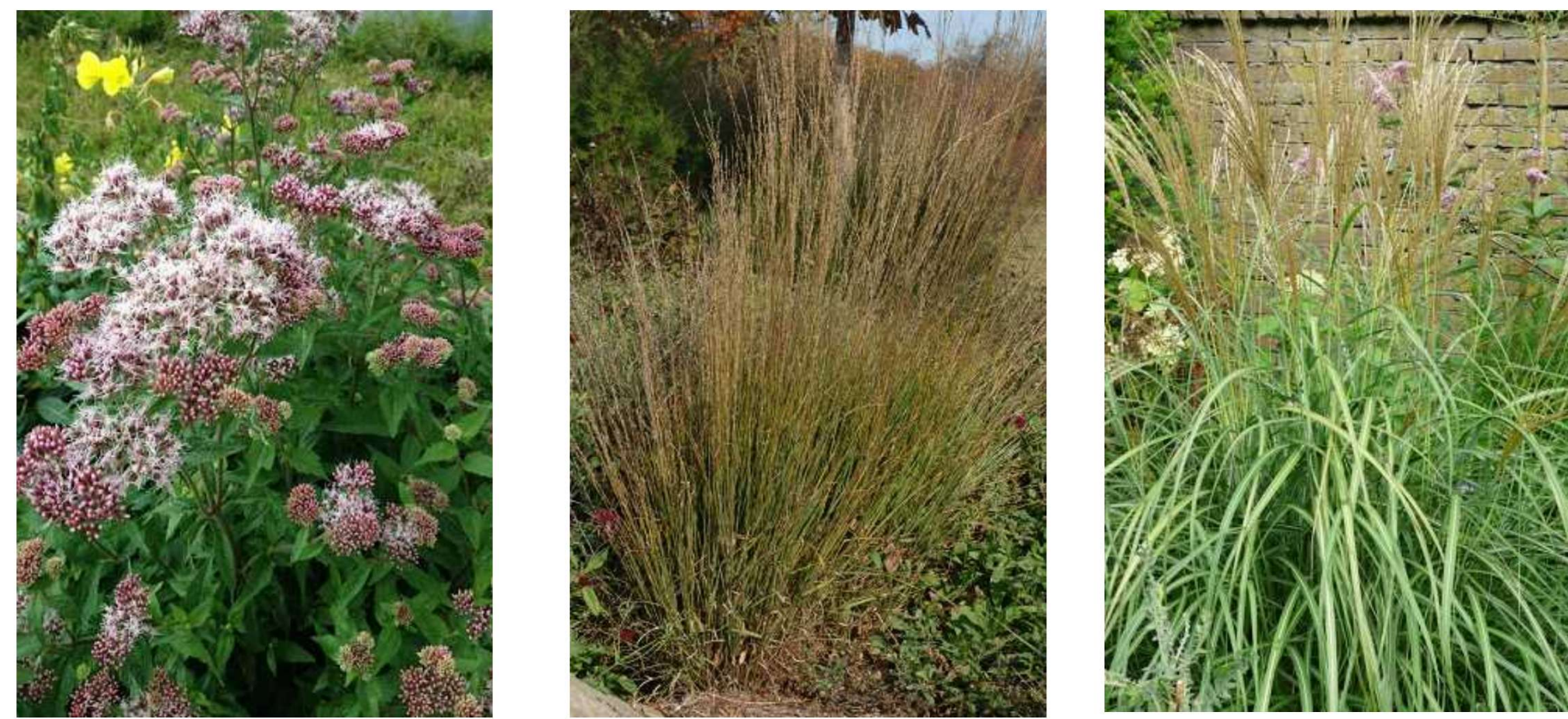
Centaurea scabiosa Molinia caerulea 'Moorhexe' Miscanthus sinensis 'Kleine Silberspinne'