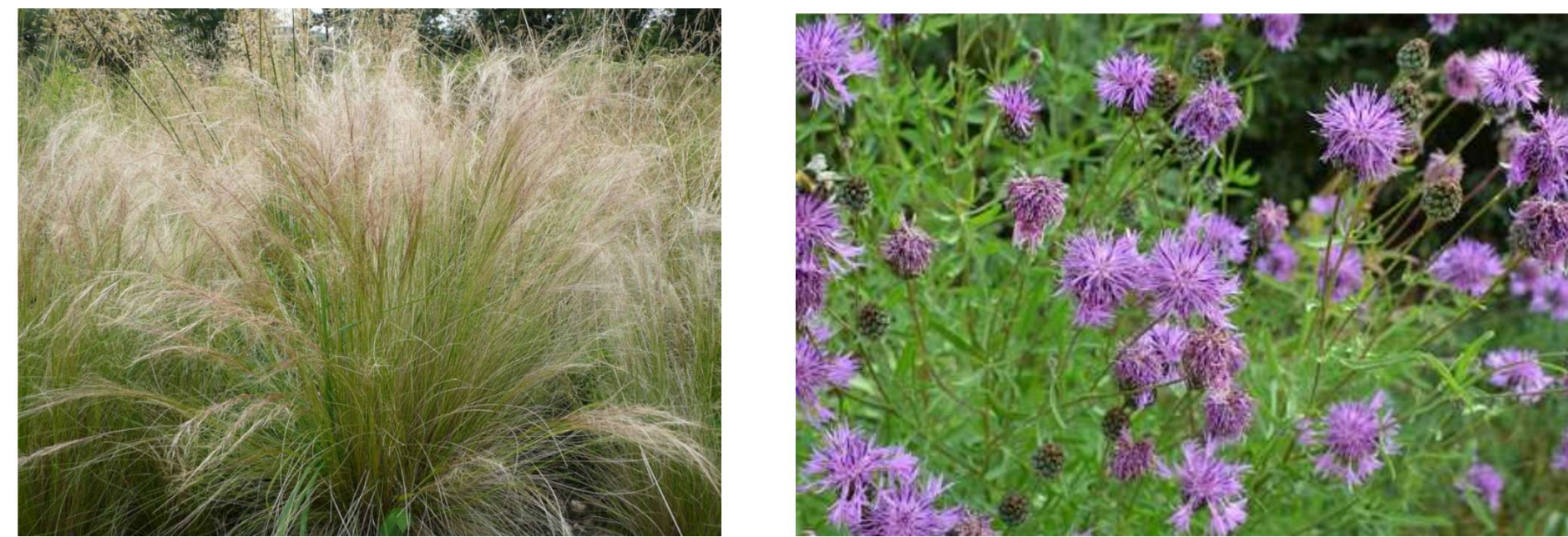
Stipa tenuissima 'Ponytails' Centaurea scabiosa