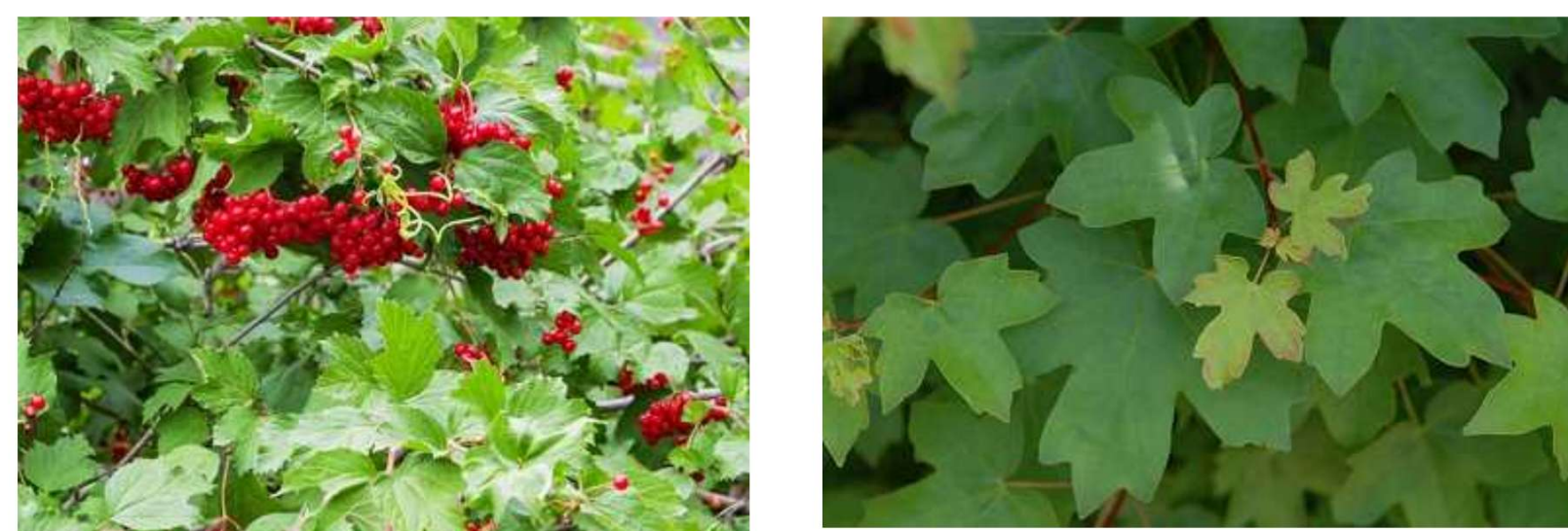
Viburnum opulus Acer campestre