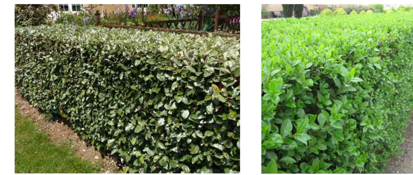
Elaeagnus ebbingei Ligustrum ovalifolium