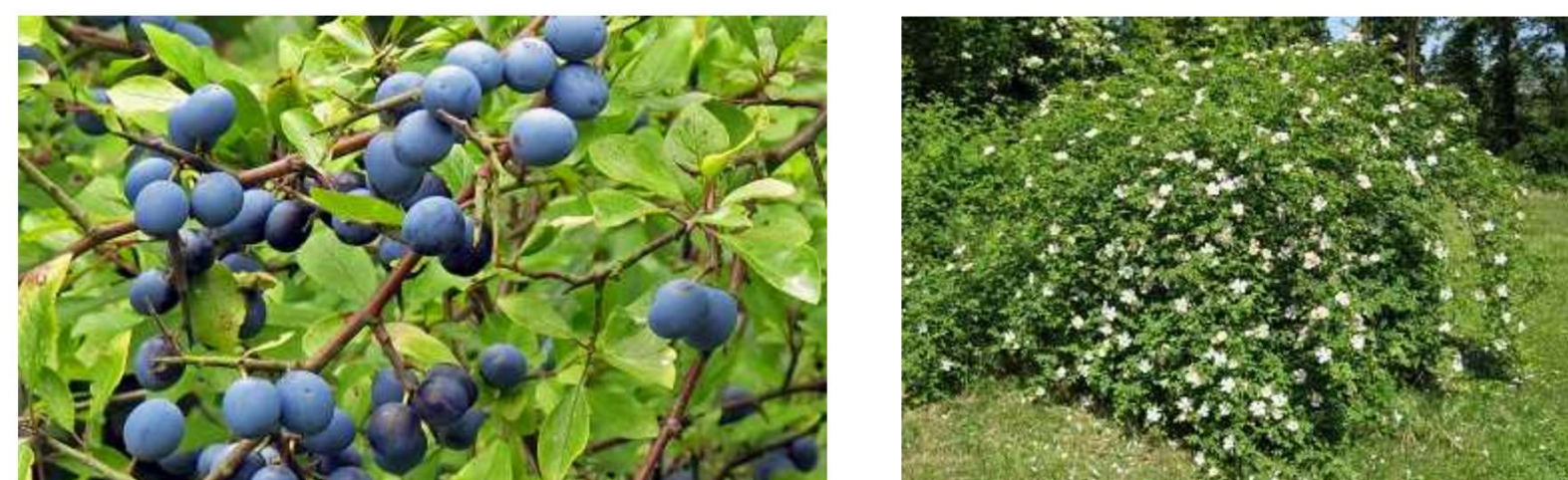
Prunus spinosa Rosa canina