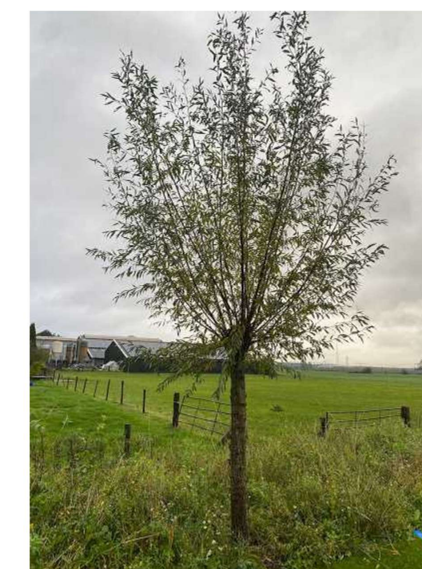
Knotwilg (Salix alba)