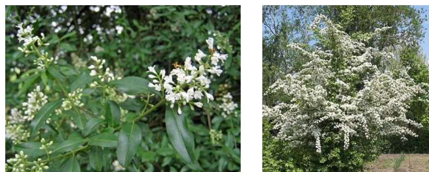
Ligustrum vulgare Crataegus monogyna