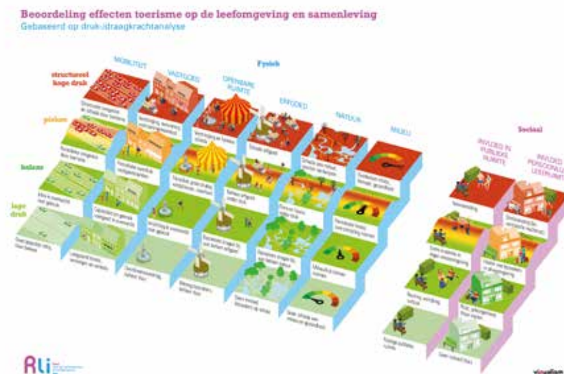
Figuur 1: Beoordeling effecten toerisme op de leefomgeving en samenleving

Raad voor de leefomgeving en infrastructuur. (2019). 'Waardevol toerisme, de leefomgeving verdient het'.