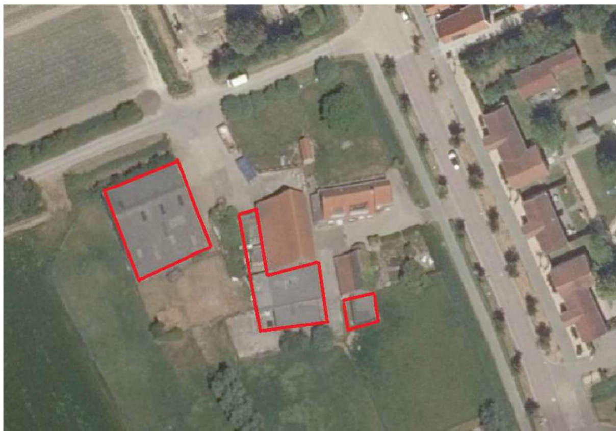
Figuur 2. Luchtfoto van het plangebied en de omgeving.

De geplande werkzaamheden bestaan uit het slopen van bebouwing. Het betreft een damwandloods en wat kleinere enkel steens schuren.