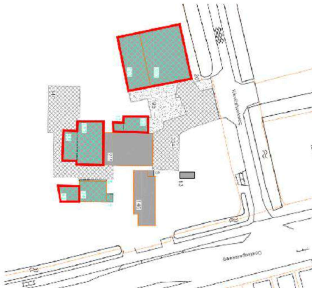
Figuur 1. Te slopen schuren

Het terrein is bezocht op 1 mei en 14 en 10 december 2021.