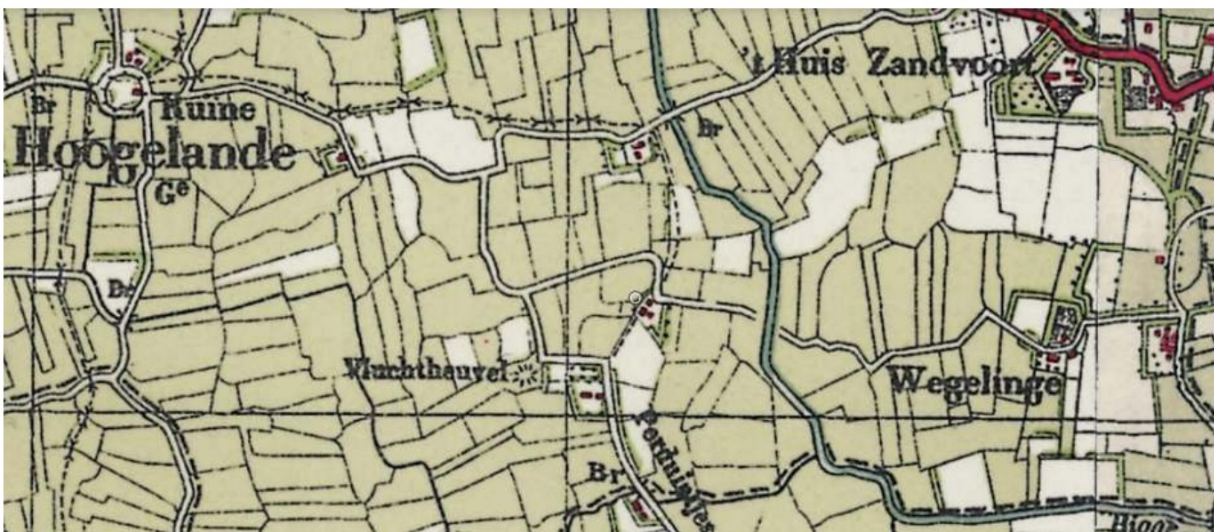
Topografische kaart 1930