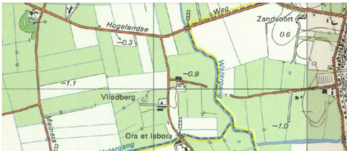
Topografische kaart 1990