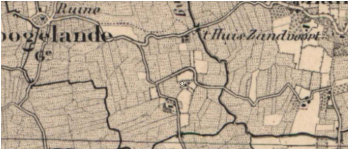
Topografische kaart 1900