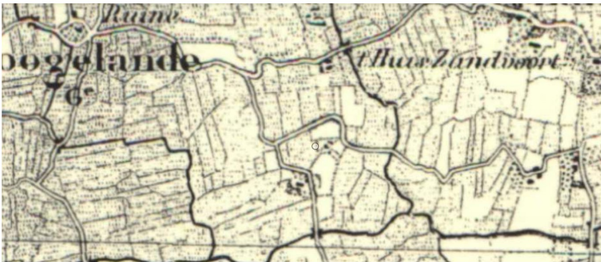
Topografische kaart 1880