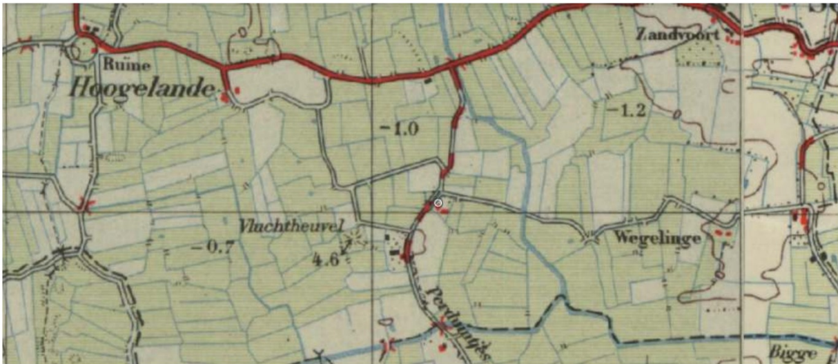
Topografische kaart 1950