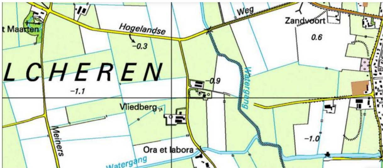
Topografische kaart 2000