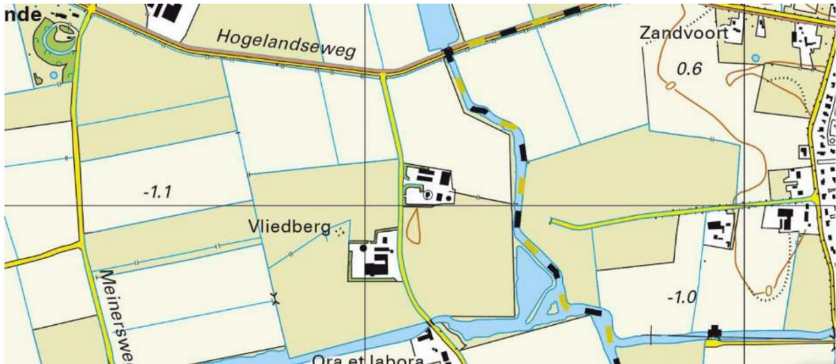
Topografische kaart 2022