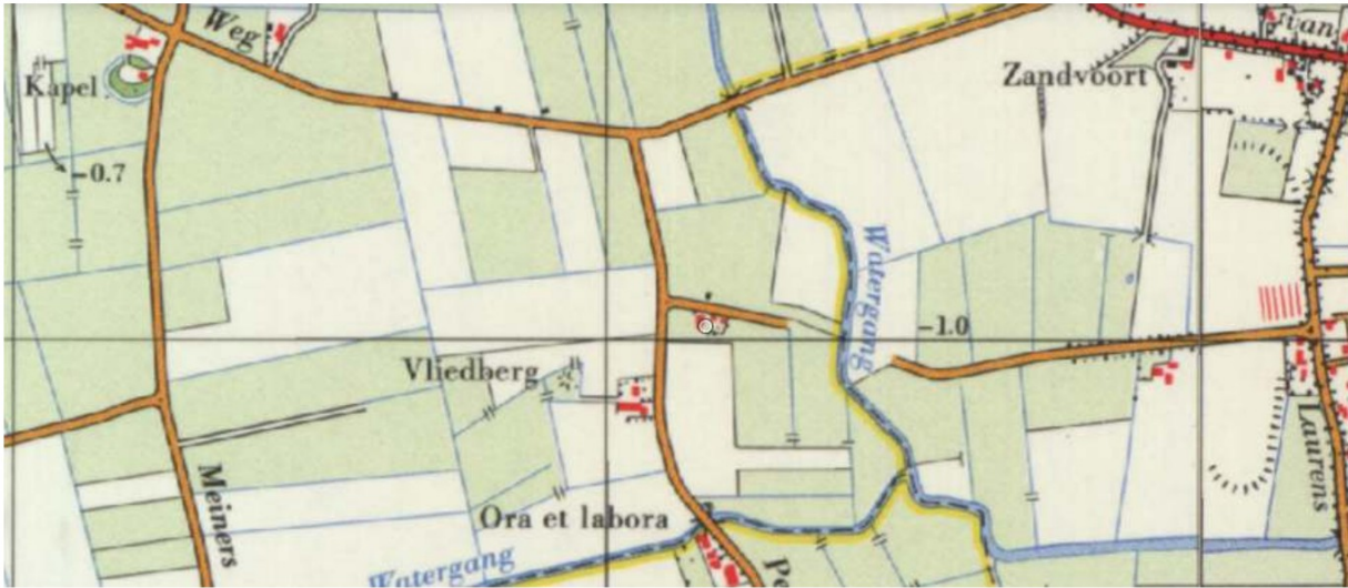
Topografische kaart 1980