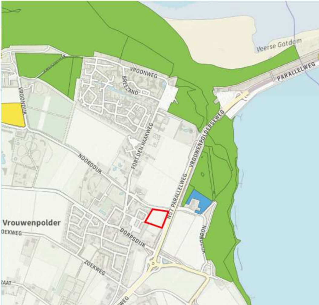
Afbeelding 10 Ligging plangebied ten opzichte van het NatuurNetwerk Zeeland

Het plangebied maakt ook geen deel uit van het NNZ. Verstoring van beschermde natuurwaarden is, gezien het karakter van de ontwikkeling en de aard van de natuurwaarden, uitgesloten.