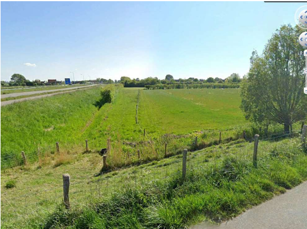
Afbeelding 6 Zicht op oostelijke rand vanaf de dijk; langs de lange windsingel ligt een droge sloot