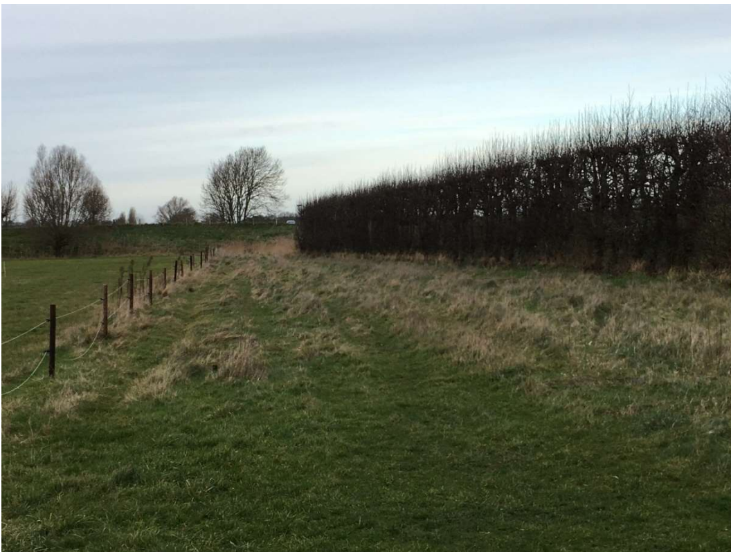
Afbeelding 5 Oostelijke rand van het plangebied