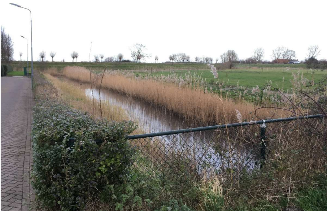
Afbeelding 3 Westelijke rand van het gebied