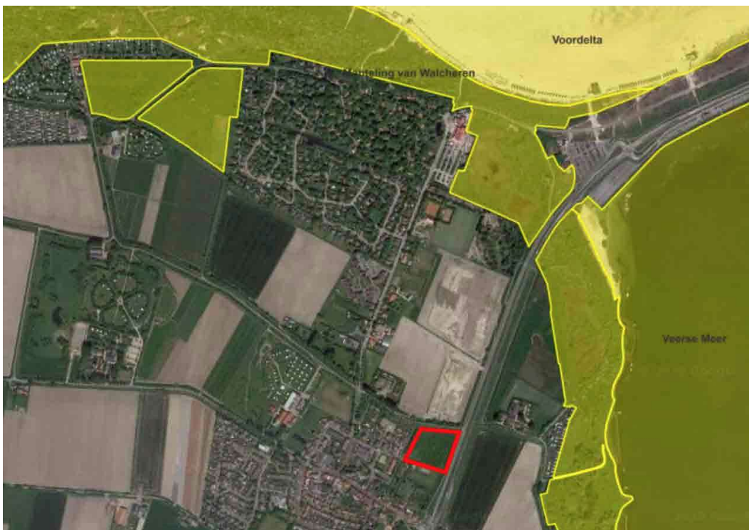
Afbeelding 9 Ligging van het plangebied en de Natura2000 gebieden.

Het plangebied vormt geen onderdeel van een natuur- of groengebied met een beschermde status, zoals Natura-2000. In de nabijheid van de projectlocatie liggen de Natura 2000-gebieden 'Manteling van Walcheren' en 'Veerse Meer'. In oostelijke richting bedraagt de kortste afstand tot het eerstgenoemde gebied circa 300 meter en in noordelijke richting ten minste 600 meter. De afstand tot het Veerse Meer bedraagt ten minste circa 500 meter. Directe effecten zoals areaalverlies en versnippering kunnen hierdoor worden uitgesloten. Gezien de afstand tot natuurgebieden en de aard en omvang van de ontwikkeling kunnen ook verstoring en verandering van de waterhuishouding worden uitgesloten.