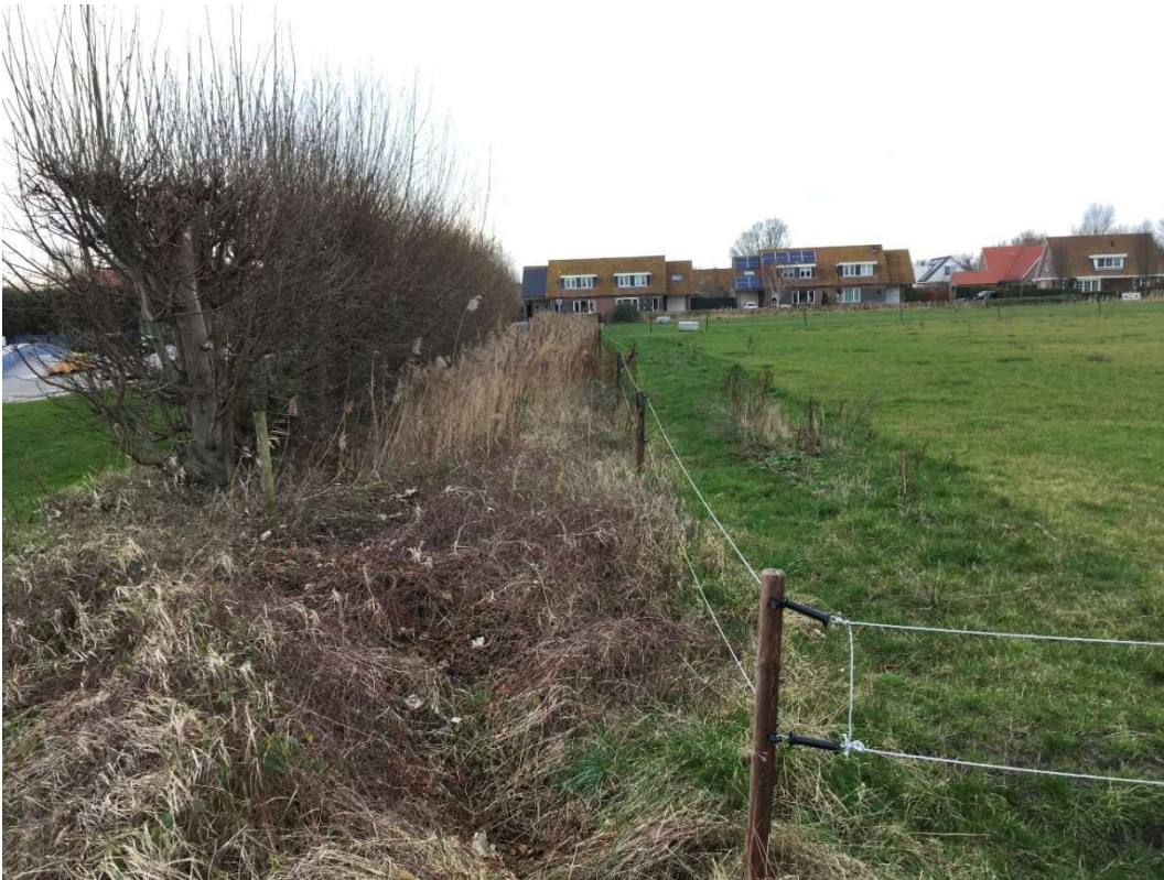
Afbeelding 4 Zuidelijke rand van het plangebied