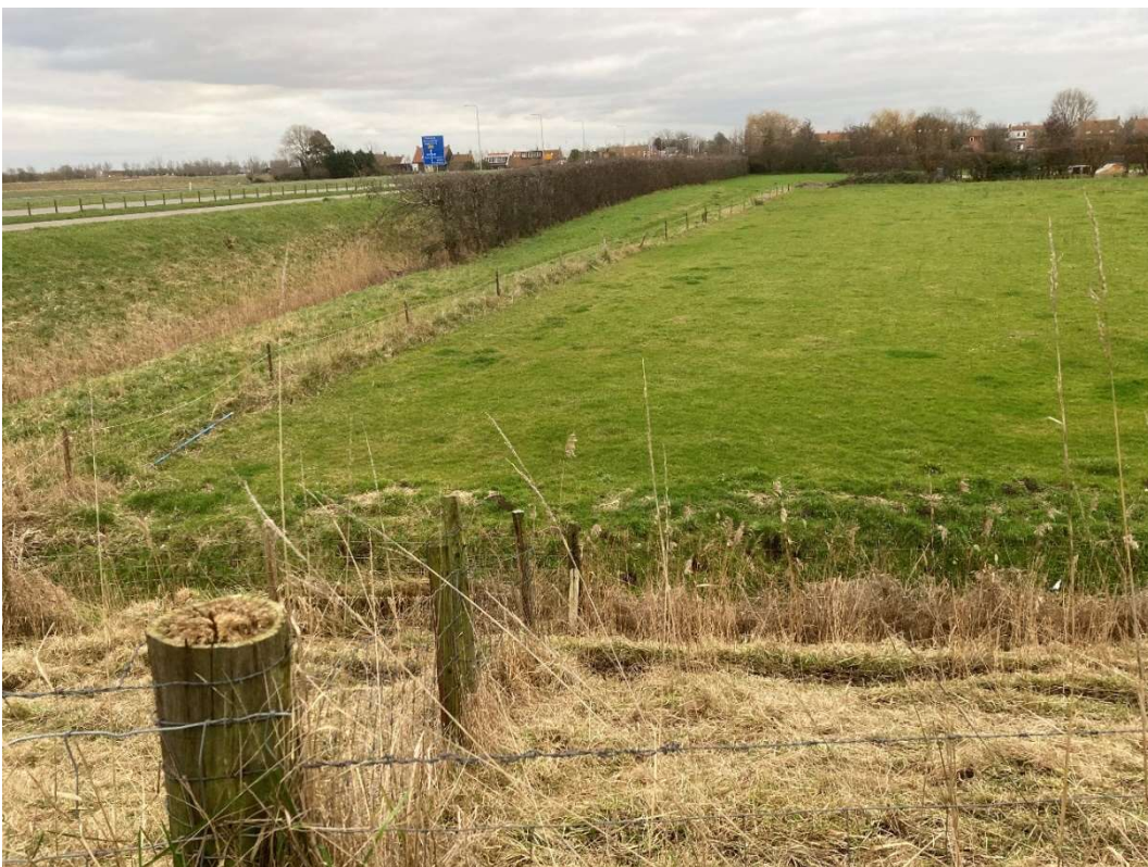
Afbeelding 7 Beeld van het oostelijke deel van het plangebied (januari 2023)