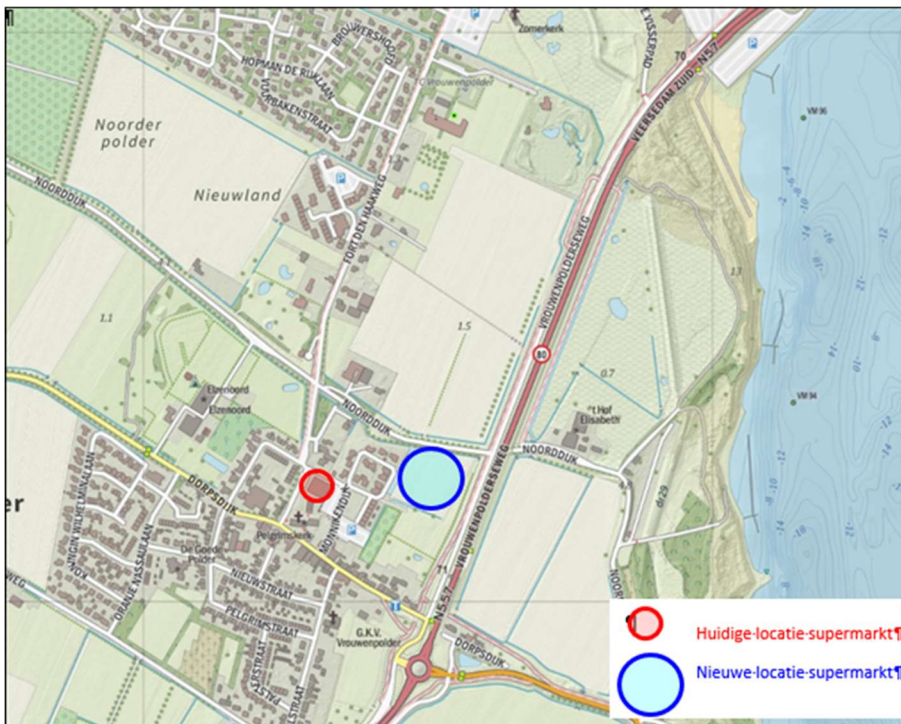
Afbeelding 1 Huidige en beoogde locatie supermarkt

Bij de voorbereiding daarvan dient te worden onderzocht of de Wet natuurbescherming (hierna: Wnb) en het beleid van de provincie ten aanzien van de bescherming van dier- en plantensoorten en de bescherming van het NatuurNetwerk Zeeland de uitvoering van het plan niet in de weg staan. Voor de beoordeling van de ecologische consequenties van het plan voor de nieuwe PLUS supermarkt is een ecologische verkenning uitgevoerd. De voorliggende memo bevat deze ecologische verkenning.