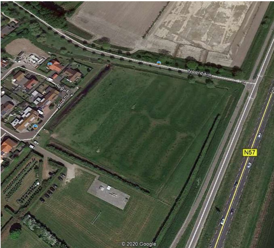
Afbeelding 2 Bepanting op en rond het plangebied