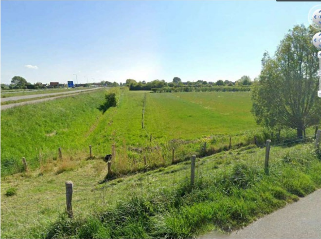
Afbeelding 6 Zicht op oostelijke rand vanaf de dijk; langs de lange windsingel ligt een droge sloot