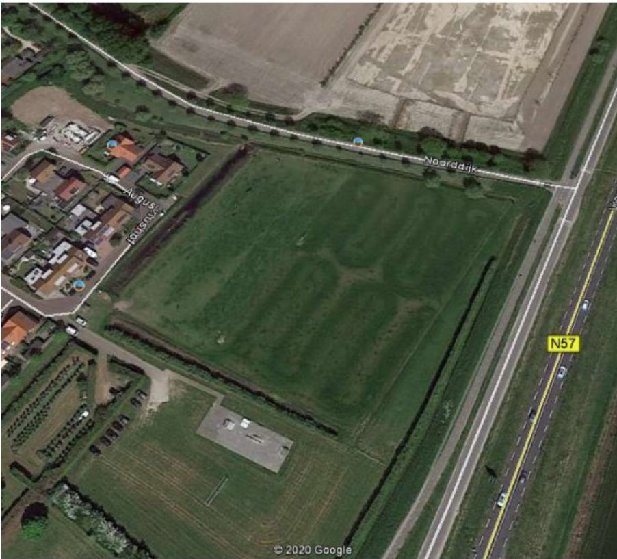
Afbeelding 2 Bepanting op en rond het plangebied