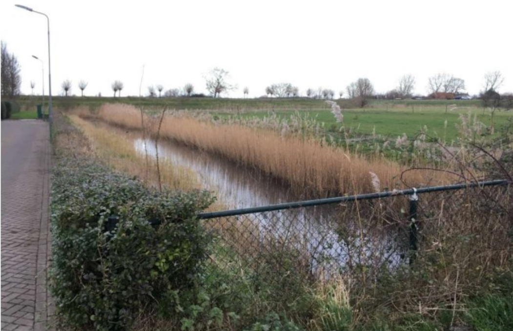
Afbeelding 3 Westelijke rand van het gebied