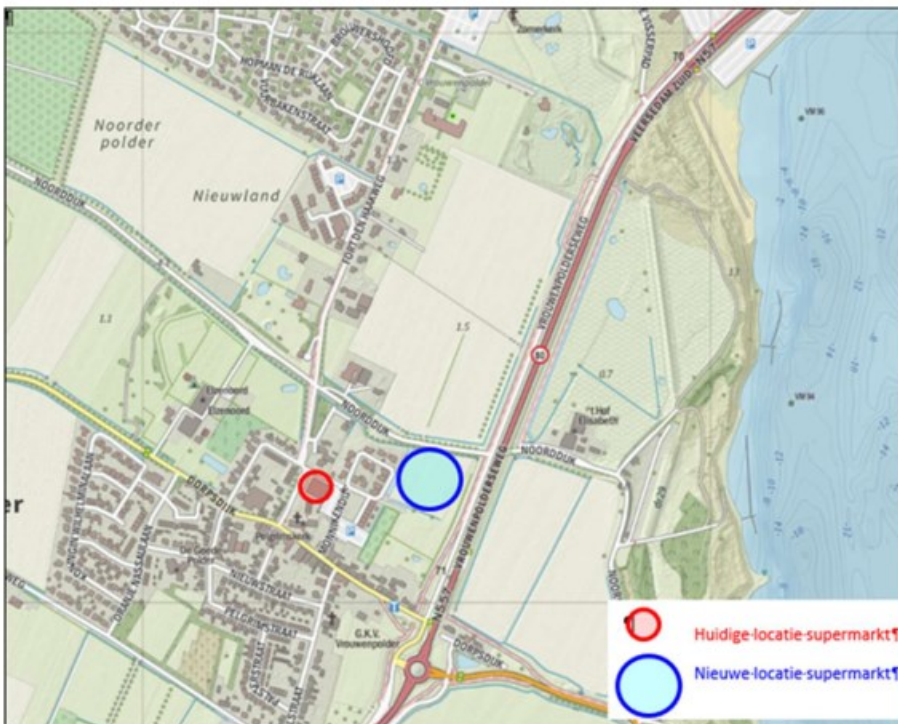
Afbeelding 1 Huidige en beoogde locatie supermarkt

Bij de voorbereiding daarvan dient te worden onderzocht of de Wet natuurbescherming (hierna: Wnb) en het beleid van de provincie ten aanzien van de bescherming van dier- en plantensoorten en de bescherming van het NatuurNetwerk Zeeland de uitvoering van het plan niet in de weg staan. Voor de beoordeling van de ecologische consequenties van het plan voor de nieuwe PLUS supermarkt is een ecologische verkenning uitgevoerd. De voorliggende memo bevat deze ecologische verkenning.