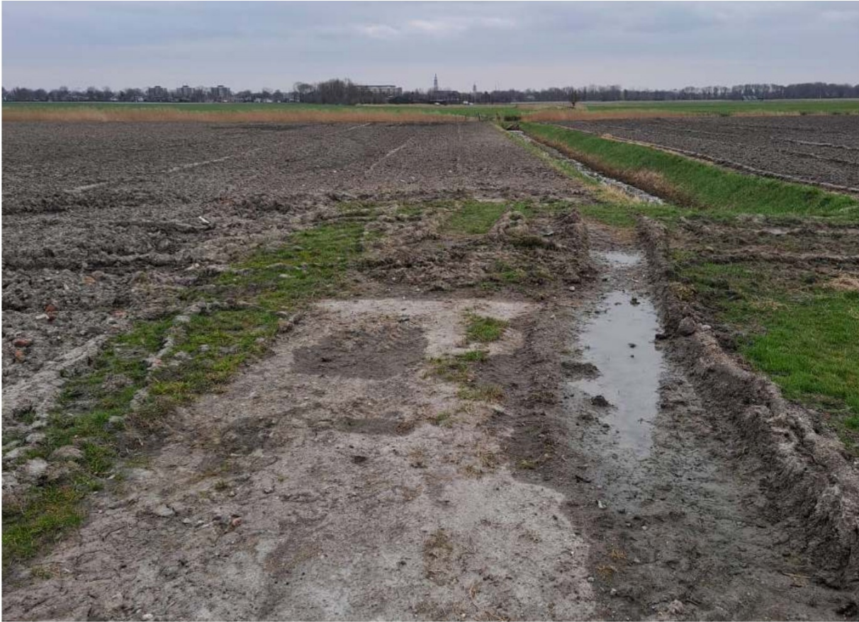
Foto's huidige situatie Pad