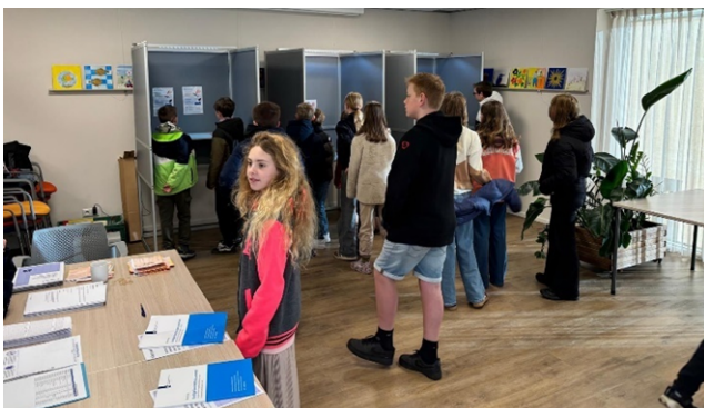
Kinderen van De Jutter mochten 's morgens vroeg een kijkje nemen in het stembureau

Op woensdag 1 april worden de nieuwe raadsleden geïnstalleerd. Elders in deze nieuwsbrief vindt u de agenda's van beide raadsvergaderingen.