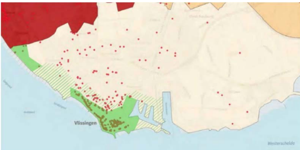
Figuur 3.1: Zoekgebieden voor nieuwe toeristische verblijfsaccommodaties

In de Toeristische Visie is onder andere beschreven: “Nieuwe toeristische verblijfsaccommodaties zijn bij voorkeur gevestigd op bewezen locaties: een strook bebouwd gebied van ongeveer een kilometer langs de kust is aangewezen als zoekgebied. De accommodaties zijn geconcentreerd in de strook Paauwenburg ten westen van de Paauwenburgweg, Boulevard, Spui-kom, Binnenstad/Scheldekwartier tot aan het Eilandje (groen gemarkeerd op de kaart). In de rest van de strook (groen gearceerd op de kaart) is er ruimte voor concepten die aansluiten bij de kwaliteit van de omgeving. Het gebied ten oosten van de Buitenhaven kent beperkingen vanwege de aanwezigheid van het munitiedepot.” ... “In de woonwijken van Vlissingen, Souburg en Ritthem worden verblijfsaccommodaties terughoudend toegestaan. Er worden regels opgesteld om recreatieve verhuur van woningen aan banden te leggen. B&B's blijven toegestaan mits deze een extra toegevoegde waarde hebben voor de kwaliteit van de omgeving.” (Toeristische Visie 2030)