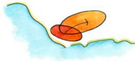
Omklassen/vergroten binnenstad door ontwikkeling Stadshavens/Scheldekwartier