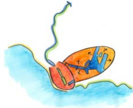
Nieuw stadshart en economisch hart door ontwikkeling Stadshavens (van badplaats naar watersportstad)