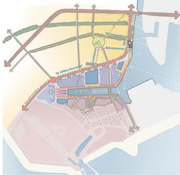
Afbeelding: ligging 'De Touwslagerij - Kanaalzijde'

Centraal in Scheldewijk, gelegen tussen het Dokter Stumphiuspark en Het kanaal door Walcheren, ligt bouwplot 'De Touwslagerij'.