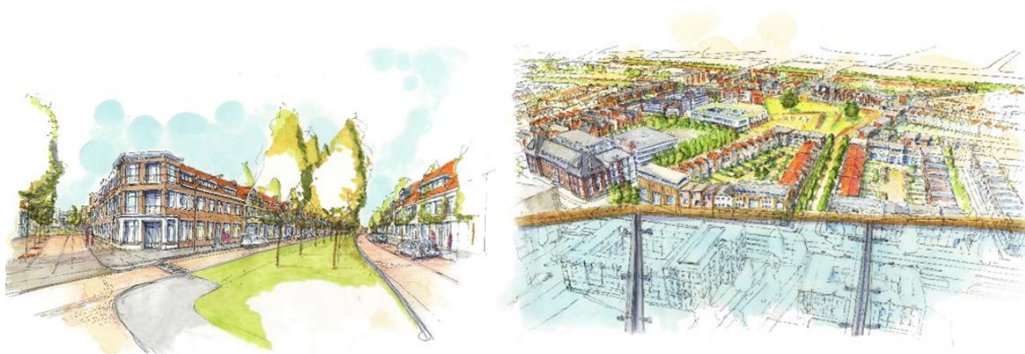
Afbeeldingen: voorbeelden van de gevraagde handgemaakte schets.

Het 2 e onderdeel betreft uw visie om de voorgestane ontwikkeling te realiseren in de huidige woningmarkt. U geeft weer wat uw afwegingen zijn om tot een bepaald woningaantal en een mix in het woningbouwprogramma te komen en waarom juist dit woningbouwprogramma op deze plek in de Vlissingse c.q. Walcherse woningmarkt en met de door u voorgestane doelgroepen passend is en voortvarend gerealiseerd kan worden.