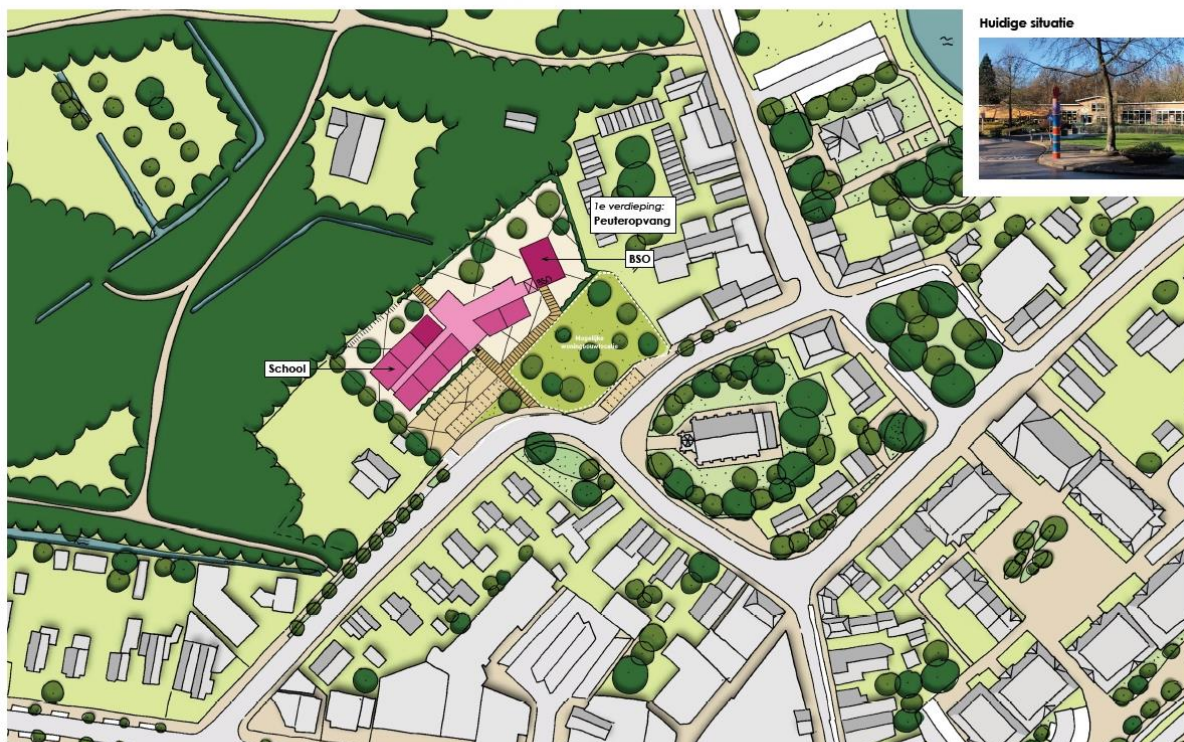
SCHOOL MET GEDEELTE VAN DE VOORZIENINGEN - Inrichting begane grond