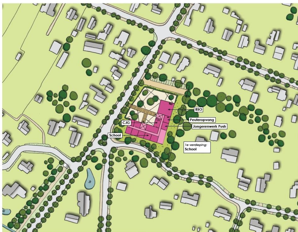
SCHOOL MET GEDEELTE VAN DE VOORZIENINGEN - Inrichting begane grond