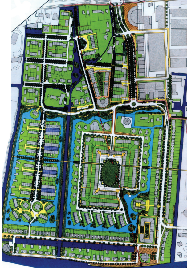
Stedenbouwkundigplan Starrenburg II + III