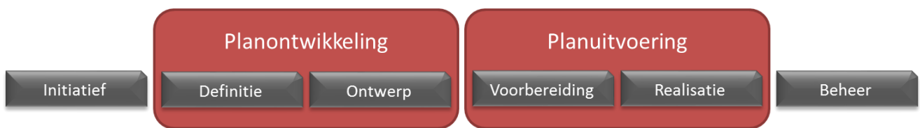
Figuur 4: De fasen van gebiedsontwikkeling

Daarom wordt in de gemeente Voorschoten projectmatig gewerkt in de volgende zes fasen (figuur 4) van gebiedsontwikkeling.