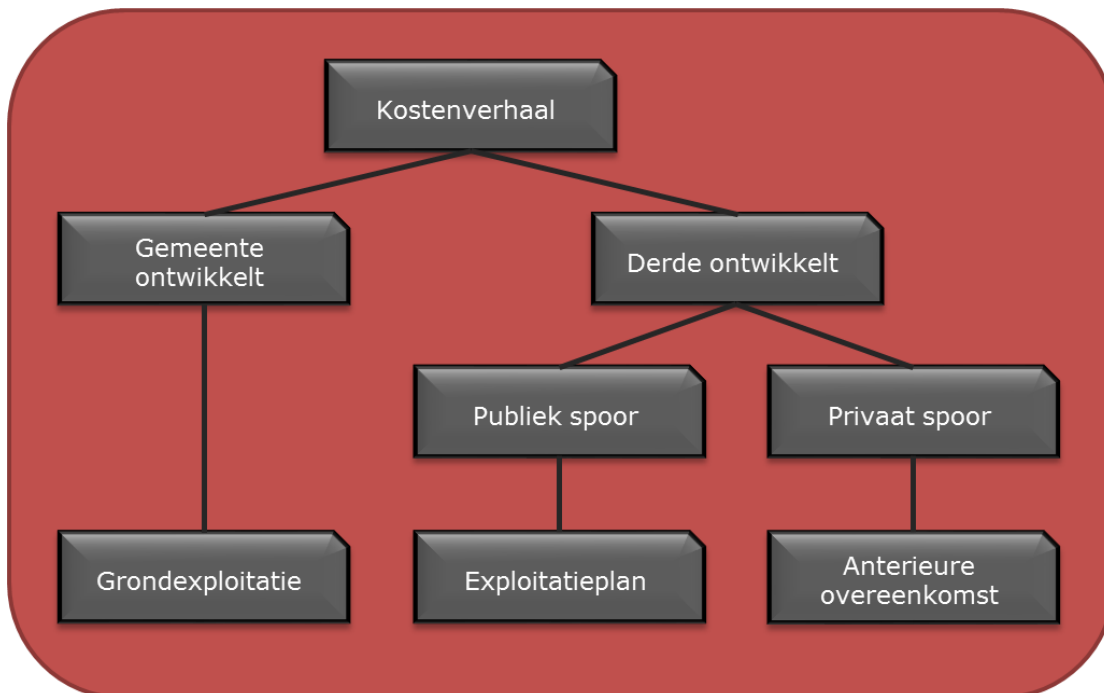
Figuur 3: vormen van kostenverhaal

Onderstaand figuur geeft de vormen van kostenverhaal weer.