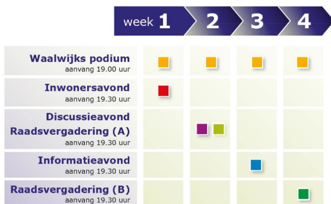
Figuur 5. Waalwijks vergadermodel

Bij het bestuderen van de documenten en bij de gesprekken over de casussen in de praktijk, wordt veelal verwezen naar het project 'Praat met de Raad'. Dit project, uitgevoerd door de raads werkgroep Communicatie, laat zien dat de raad - ondanks bovenstaande constatering - wel degelijk bezig is haar positie en democratische legitimiteit te verbeteren in de context van de veranderende samenleving en dus toenemende roep om burgerparticipatie. Het hoofddoel van dit project is 'De raad communiceert actief met inwoners en houdt op een transparante wijze rekening met hun wensen.' Gekozen is om interactief te komen tot aanbevelingen en verbetervoorstellen, door uitvoerig te spreken met inwoners, de raad, college en de ambtelijke organisatie. Het meest ingrijpende verbetervoorstel van het project om het hoofddoel te bereiken, is het aanpassen van het Waalwijks vergadermodel (zie figuur 5). Hiermee is de raad begin 2017 van start gegaan.