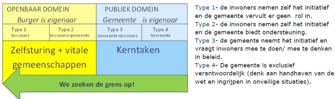
Figuur 2. Model van zelfsturing, basis voor veranderende overheid (uit Notitie burgerparticipatie 2015)