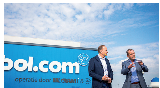
Feestelijke opening bol.com