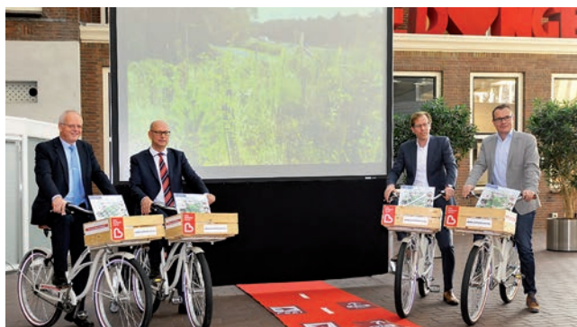
Snelfietsroutes Brabant krijgen vorm