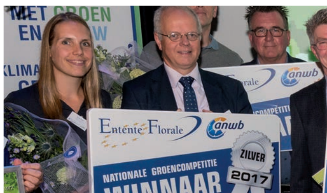
Waalwijk wint zilver bij Entente Florale