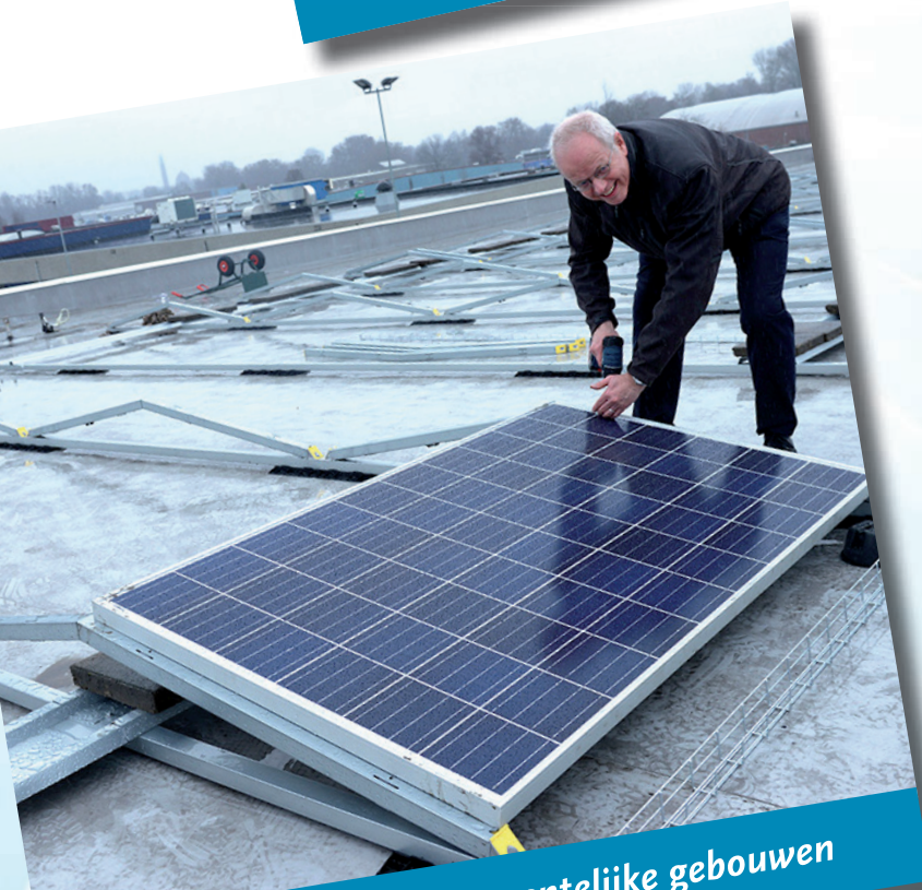
Zonnepanelen op gemeentelijke gebouwen