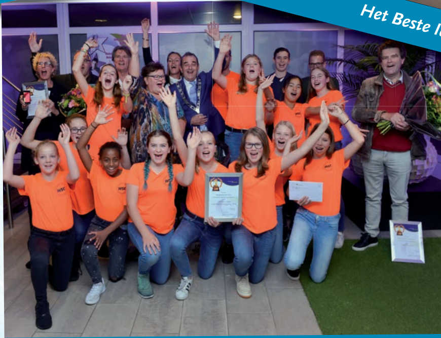
Winnaars Waalwijk Ontmoet