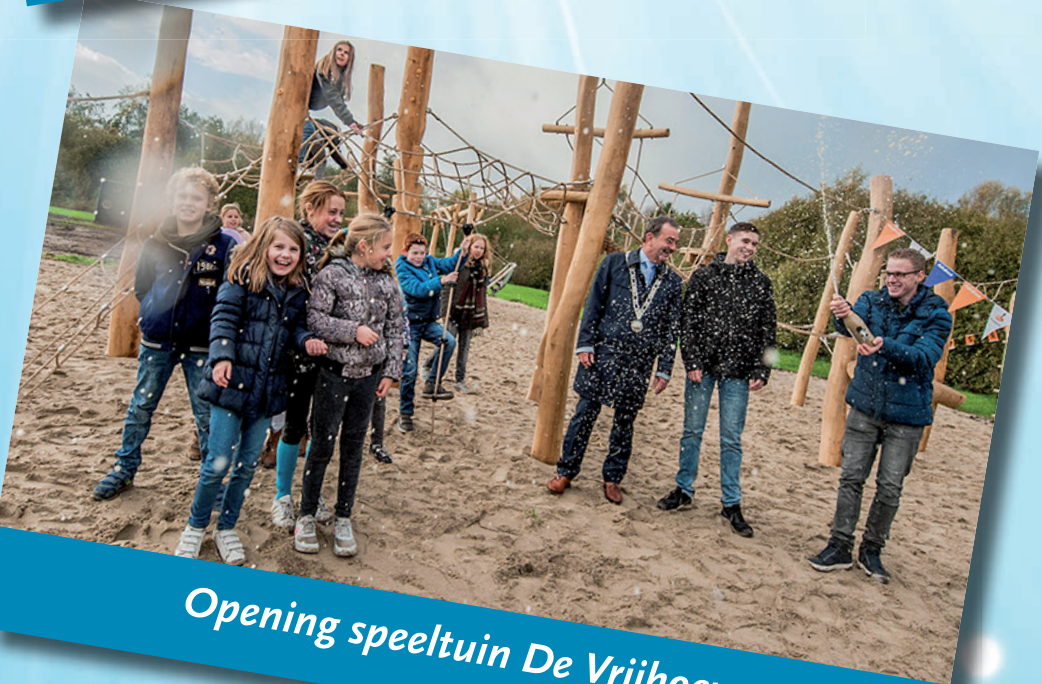
Opening speeltuin De Vrijhoeve