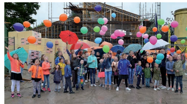
Nieuwbouw basisschool De Brug