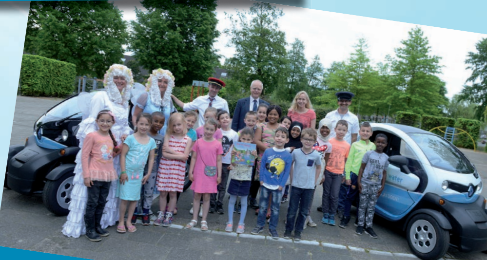
De Week van het Water