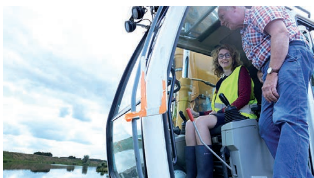
Planten feestboom De Spranckelaer

Dat werkt. Net zoals elkaar aanspreken of samen iets aanpakken. Samen maken we onze gemeente in 2018 nog duurzamer! Korte dagen, lange avonden: deze tijd van het jaar nodigt ook uit tot vooruitkijken.