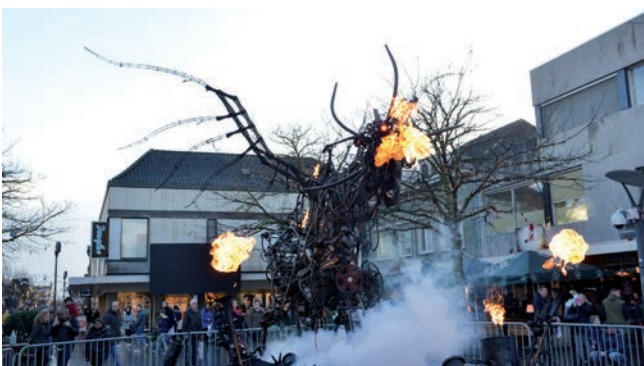
Vuurspuwer Elsie tijdens ‘Vuur en Vlam’