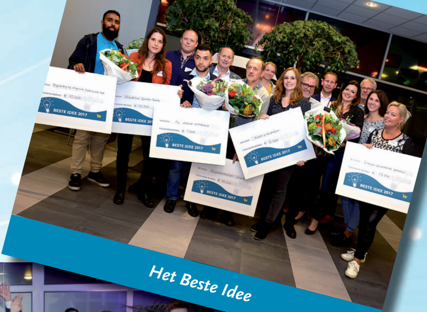
Het Beste Idee