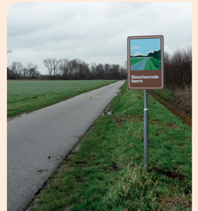
Het Beschermde Berm-bord aan de Mannenbeemdweg.

Drie bekende dumpplekken riepen we eind 2023 uit tot Beschermde Berm. Allemaal liggen ze in het buitengebied tussen Waalwijk en Sprang-Capelle. Voorbijgangers zien hier nu een bermbord dat doet denken aan de beschermende status van het werelderfgoed. Hier dump je toch niet zomaar je afval? Op twee van de drie plekken zagen we inderdaad minder afval na het plaatsen van de borden. In de zomer van 2024 komen er drie nieuwe Beschermde Berm-plekken bij.