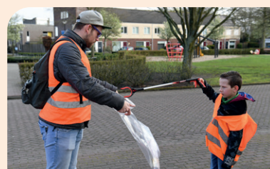
De opruimactie van Scouting Mgr. Bekkersgroep.