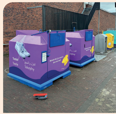
Veel containers in onze gemeente kregen een fris jasje.