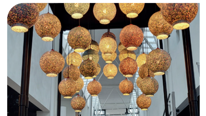
De kroonluchter hing dit jaar ook in Theater De Leest in Waalwijk.

In 2022 werd de Kroonluchter Waalwijk onthuld. Een kunstwerk gemaakt van versnipperde petflessen. Sindsdien toert deze door de gemeente. Dit jaar krijgt Kroonluchter Waalwijk er een extra ring met 24 lampen bij! Samen maken we het kunstwerk groter en mooier. Fiets ook een lamp bij elkaar met jouw bedrijf, vereniging, buurtcentrum of evenement! Kijk voor meer info op www.kroonluchterwaalwijk.nl