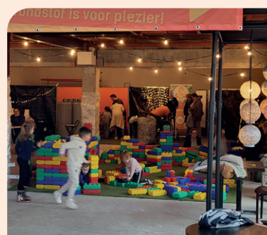
Het PetPretPark in de kerstvakantie in De Els in Waalwijk.