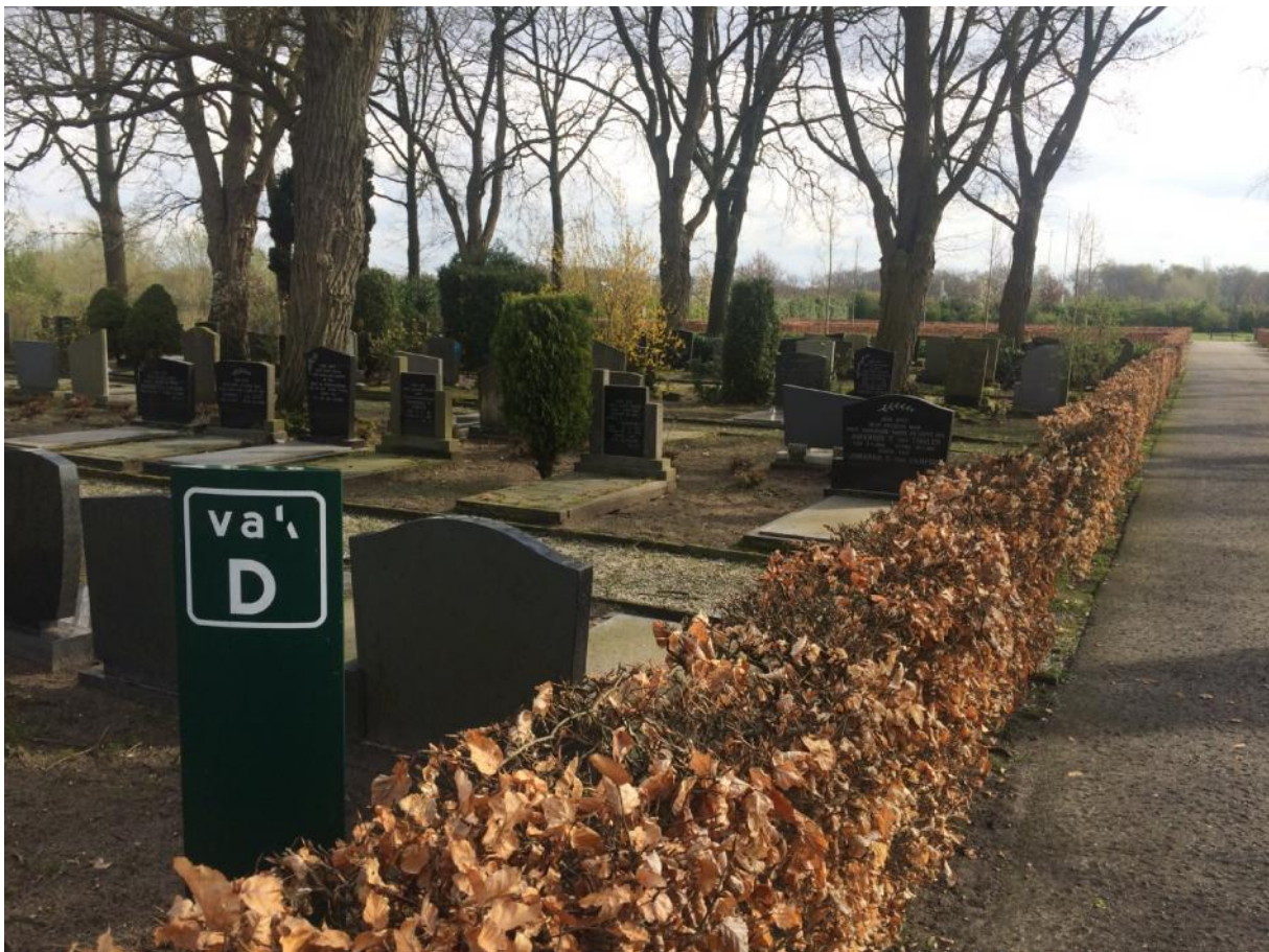
Grafvak D algemene begraafplaats aan de Tilburgseweg in april 2019.

Bij deze treft u onze eerste nieuwsbrief aan. De gemeente Waalwijk en aannemer Verhagen Kaatsheuvel informeren u hiermee over de stand van zaken van de werkzaamheden. Indien mogelijk verzoeken wij u de nieuwsbrief te delen met uw familieleden of nabestaanden van andere graven op deze begraafplaats. In de periode tot en met juni 2021 proberen wij namelijk zoveel mogelijk nabestaanden te bereiken en uw medewerking daarbij is voor ons erg belangrijk. Alvast bedankt!