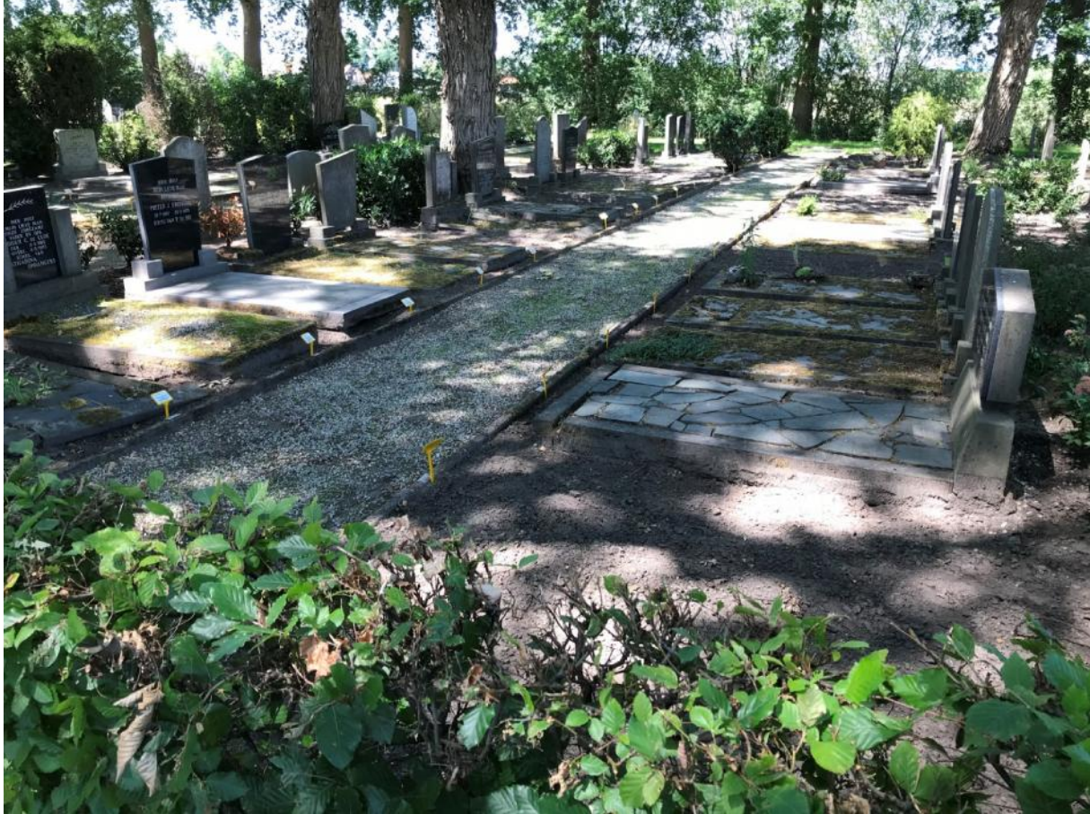
De huidige situatie begin juli 2020.