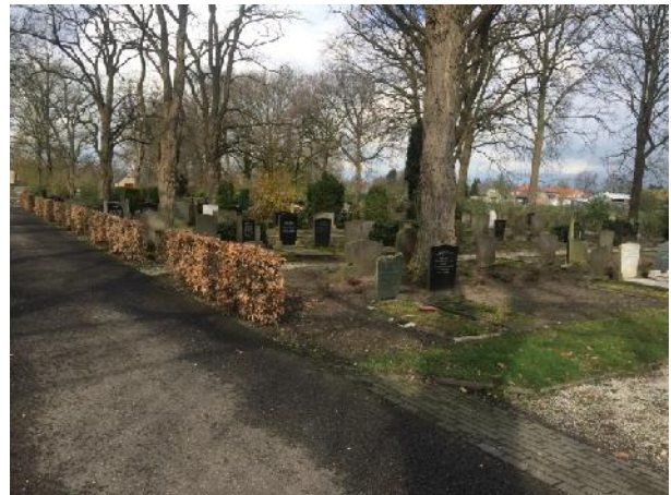
Grafvak D algemene begraafplaats aan de Tilburgseweg in april 2019.