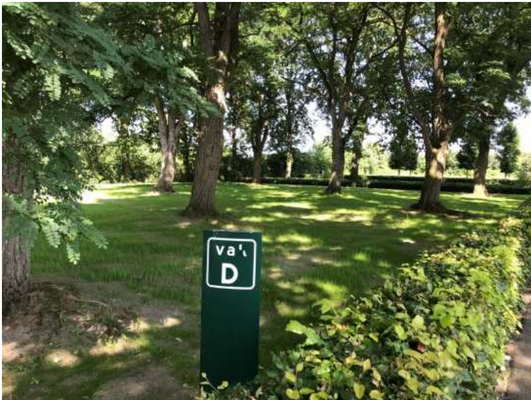
Vak D na de ruiming van de grafmonumenten, gefotografeerd 11 augustus 2021.