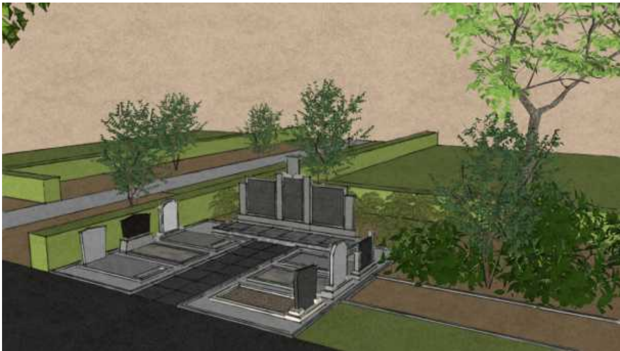
Het verzamelgrafmonument aan de zuidzijde van de hoofdlaan tegenover vak D.

Pas wanneer de grote bomen op vak D ooit worden gerooid, zullen de stoffelijke resten uit vak D worden overgebracht naar een verzamelgraf direct achter het verzamelgrafmonument.