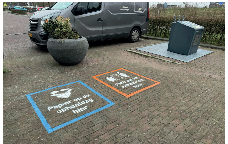
Een nieuw papiervak en pmd-vak bij een bestaande ondergrondse container.

Vorige week zijn we al druk bezig geweest om alles in orde te maken. Deze week werken we het verder af. Alle informatie over hoe we in de gemeente Waalwijk omgaan met afval vind je op waalwijk.nl/afval en in de AfvalWijzer-app.