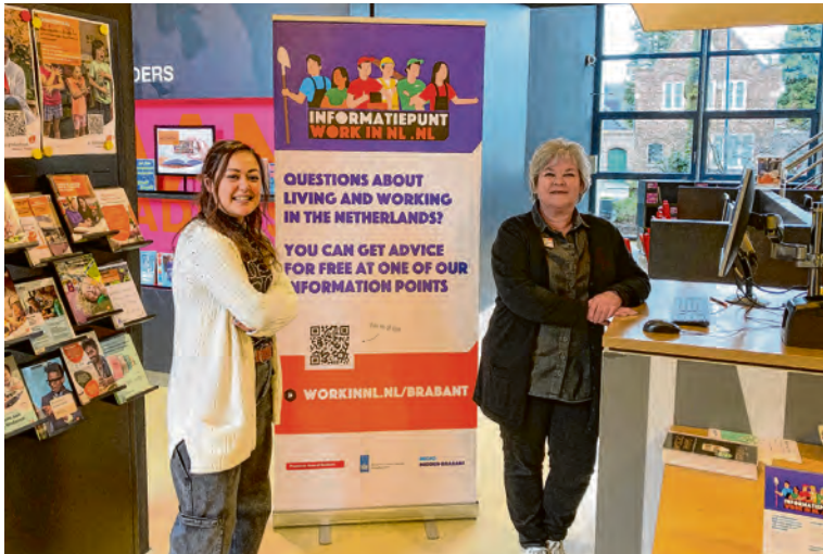
Medewerkers van De Bibliotheek Waalwijk bij het informatiepunt.

Deze medewerkers krijgen hulp bij vragen over wonen en leven. Dat doen we op verschillende manieren. Vanaf 2 januari is daar het Brabants Migratie Informatie Punt (BMIP) bij gekomen. Een samenwerking tussen rijk, provincie, bedrijfsleven en gemeenten. Op 2 januari opende Tilburgse wethouder Yusuf Celic en onze Waalwijkse wethouder Sheila Schuijffel het eerste fysieke punt in Tilburg. Nu openen we op 1 februari 2024 het fysieke informatiepunt in Waalwijk.