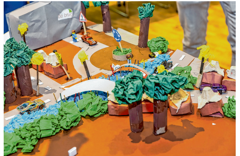
Het schaalmodel van een groepje leerlingen van basisschool De Brug.

De leerlingen hebben in groepjes de ideeën uitgewerkt. Die hebben ze met een presentatie en een schaalmodel aan de wethouder en aan het projectteam gepresenteerd. De ideeën liepen uiteen. Van het maken van een loopbrug tot het verplaatsen van het zebrapad aan het uiteinde van de brug.