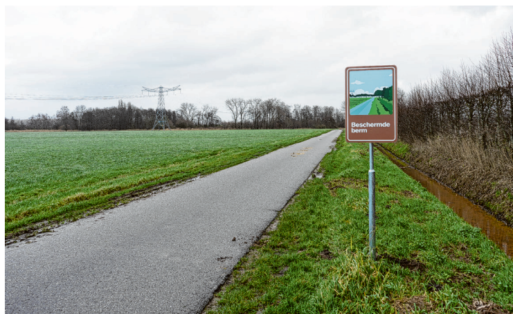
Het 'Beschermde berm'-bord bij de Mannenbeemdweg in Waalwijk.

De twee overgebleven borden blijven staan. En samen met onze aannemers gaan we kijken of we de Beschermde Berm kunnen uitbreiden. Zo wordt steeds meer berm weer leefgebied van planten en dieren.