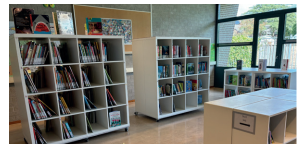
Schoolbibliotheek op OBS De Hoef.

"Wij lezen heel veel op school. Het is belangrijk dat kinderen ook thuis lezen. Als ouders voorlezen, samen met kinderen naar de Bibliotheek gaan en zelf ook lezen, helpt dat heel erg. Daarom zullen wij de ouders van onze leerlingen dit schooljaar uitnodigen voor leuke lees-activiteiten."