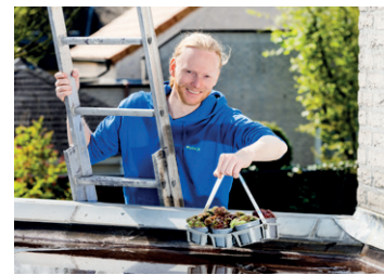
Maak je dak groen