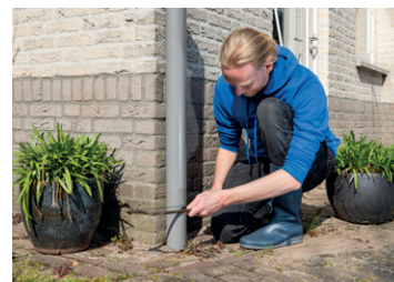
Zaag je regenpijp af