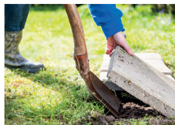
Wip je tegels