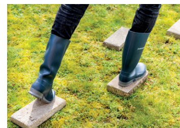
Maak een waterdoorlatend pad