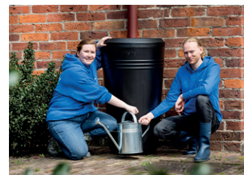
Plaats een regenton