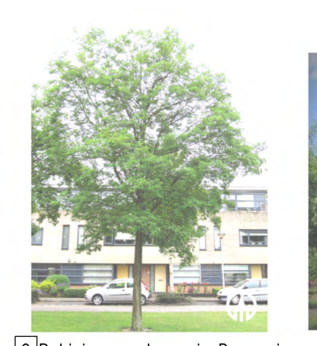
2 Robinia pseudoacacia Bessoniana