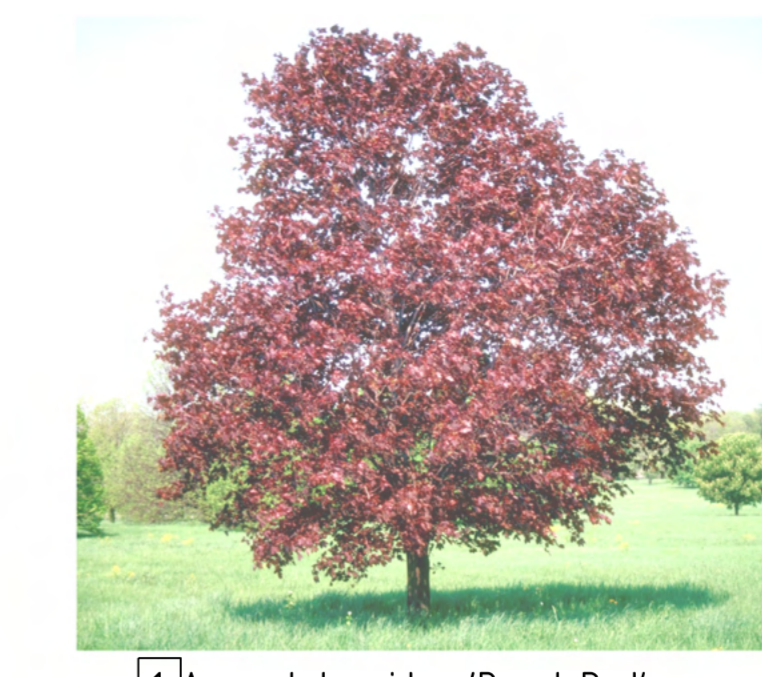
1 Acer platanoides 'Royal Red'