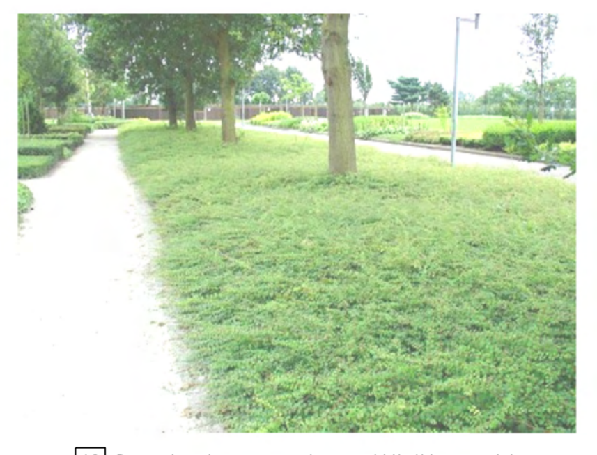
12 Symphoricarpos chenaultii 'Hancock'