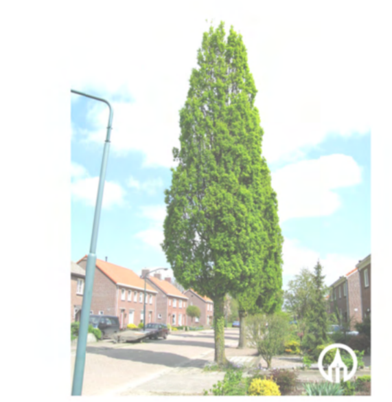
8 Quercus robur Fastigiata Koster