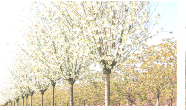
5 Prunus x gondouinii 'Schnee'