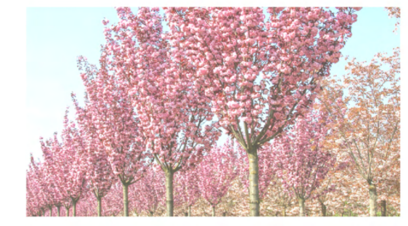
4 Prunus serrulata Royal Burgundy