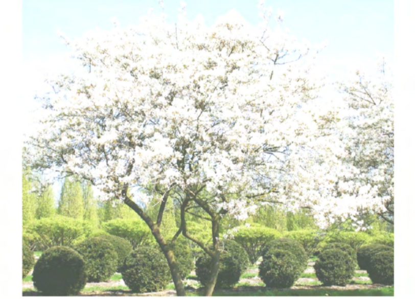
9 Amelanchier lamarckii (heester)