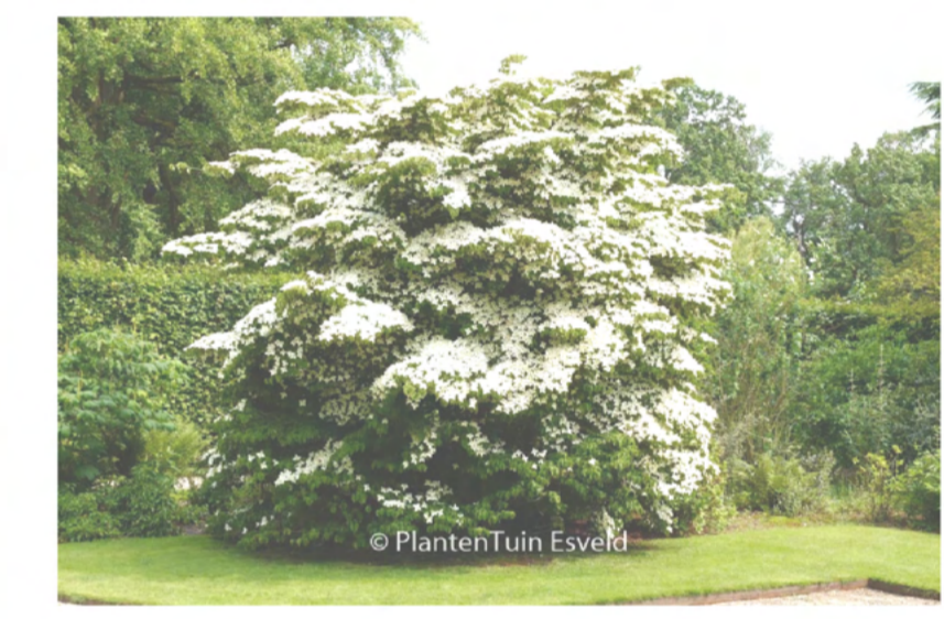
10 Cornus kousa (heester)