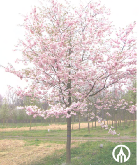
6 Prunus accolade