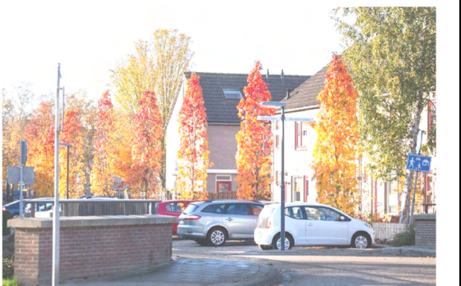
7 Liquidambar styraciflua 'Slender silhouette'