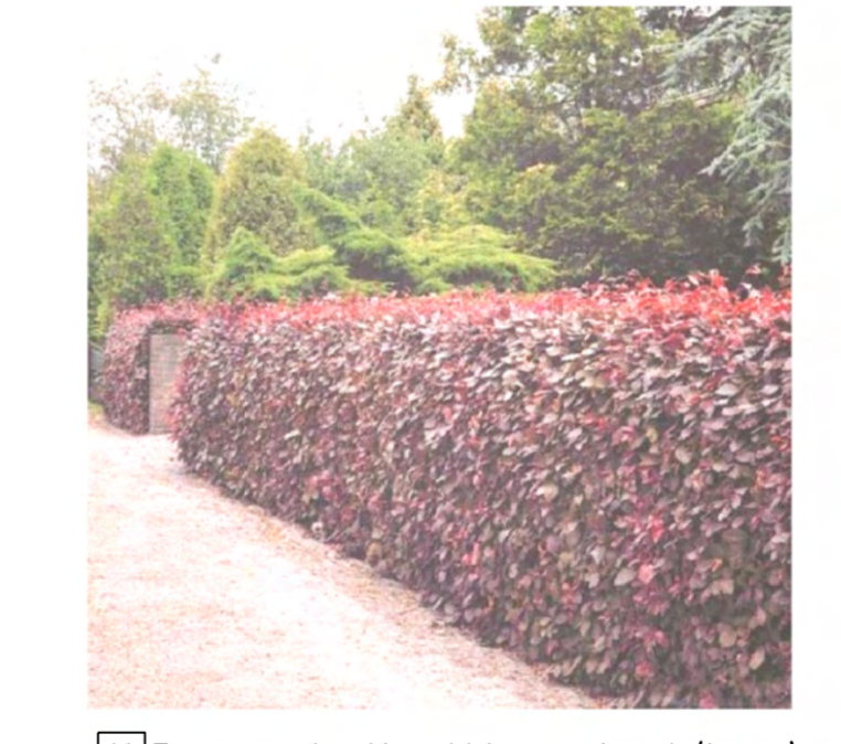
11 Fagus sylvatica 'Atropunicea' (haag)