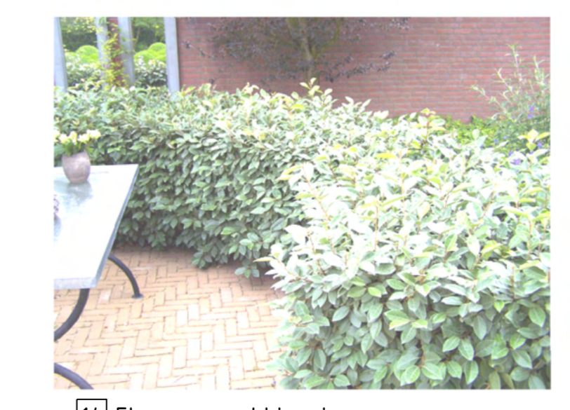
14 Elaeagnus ebbingei