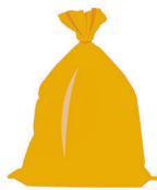
Pmd-afval: 1 x 2 weken 60L zak

Zo gaat de inzameling van het afval er vanaf 2026 voor de meeste huishoudens uitzien.