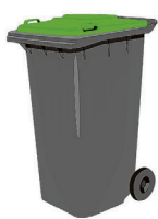
Gft-afval: 1 x 2 weken 140 of 240L