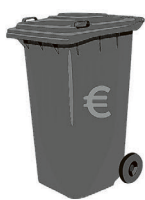
Restafval: 1 x 4 weken 140L

Kijk op www.waalwijk.nl/afval en dan op 'Veranderingen 2026' voor een overzicht van alle veranderingen. Je vindt hier ook veel gestelde vragen en antwoorden.