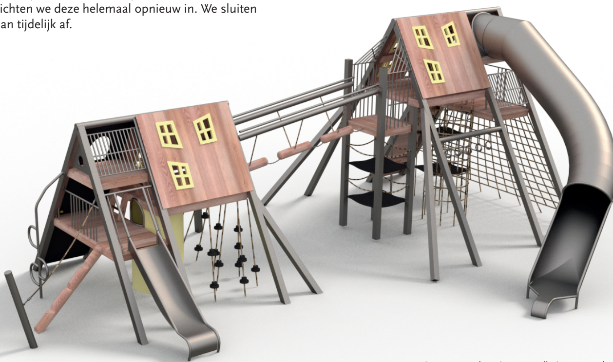
Ontwerp van het nieuwe speelhuis voor speeltuin het Lido

Wij kijken er enorm naar uit om de nieuwe speeltuin feestelijk te openen. Daar komen we later op terug. Voor nu alvast: geniet van al het speelplezier dat het te bieden heeft!