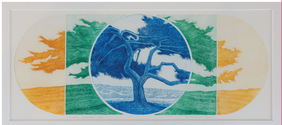
Winnende kunstwerk van Ron Beumer.