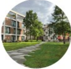
Appartementen in het groen