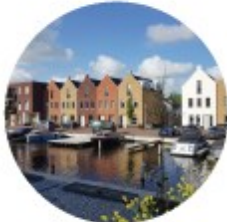
Wonen aan het water

Wat kunnen we realiseren? Eerste Indikatieve Impressiebeelden