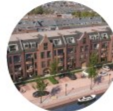
Appartementen aan het water