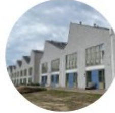
Erfgoed als inspiratie