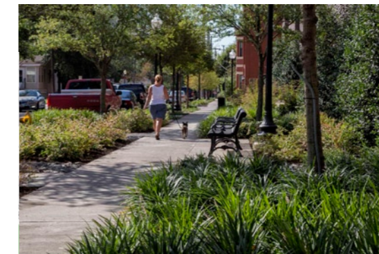
referenties groene borders