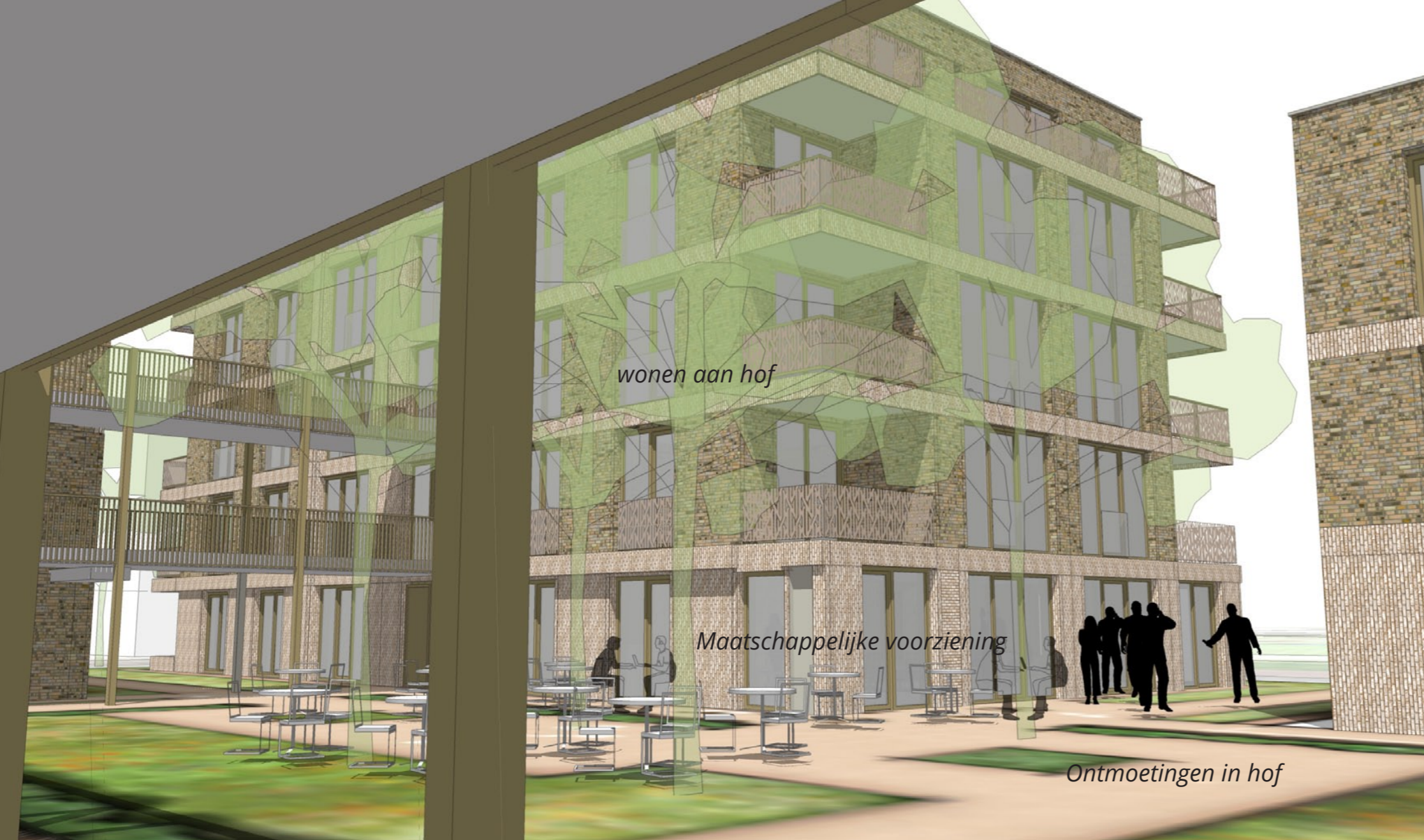
Accent vanuit hof