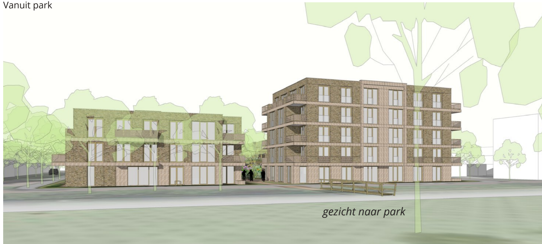
gezicht naar park