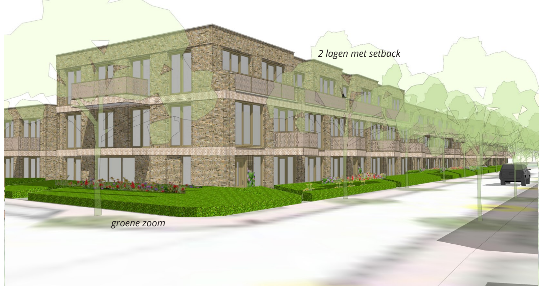
2 lagen met setback