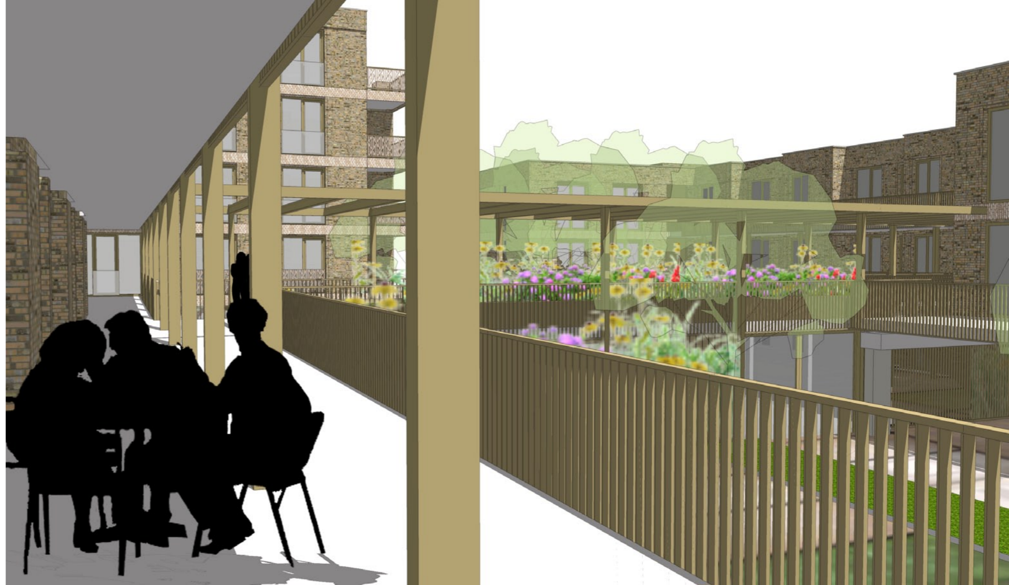
brede galerijen met leefplekken en uitzicht op te begroeiën pergola's