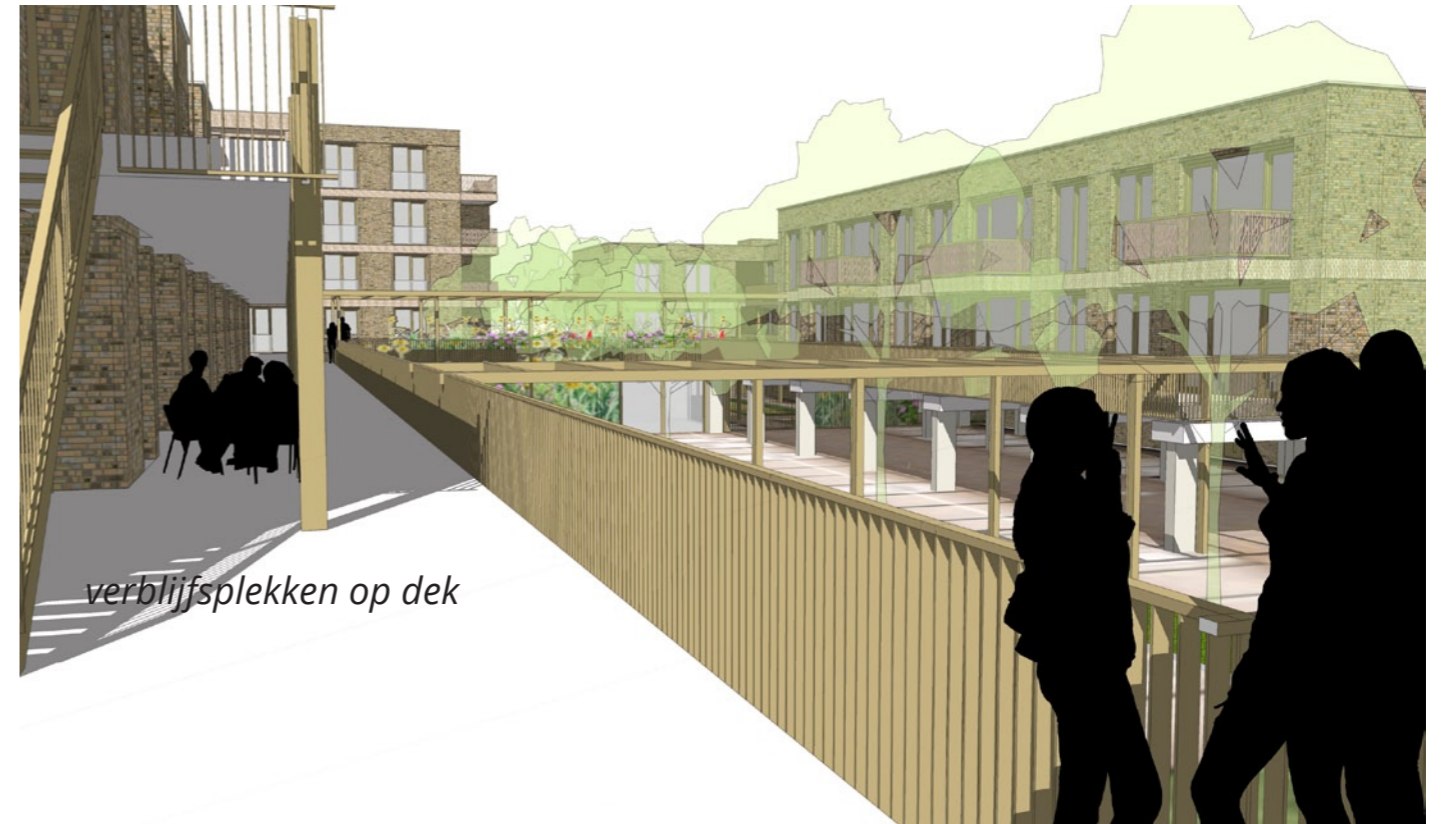
verblijfsplekken op dek