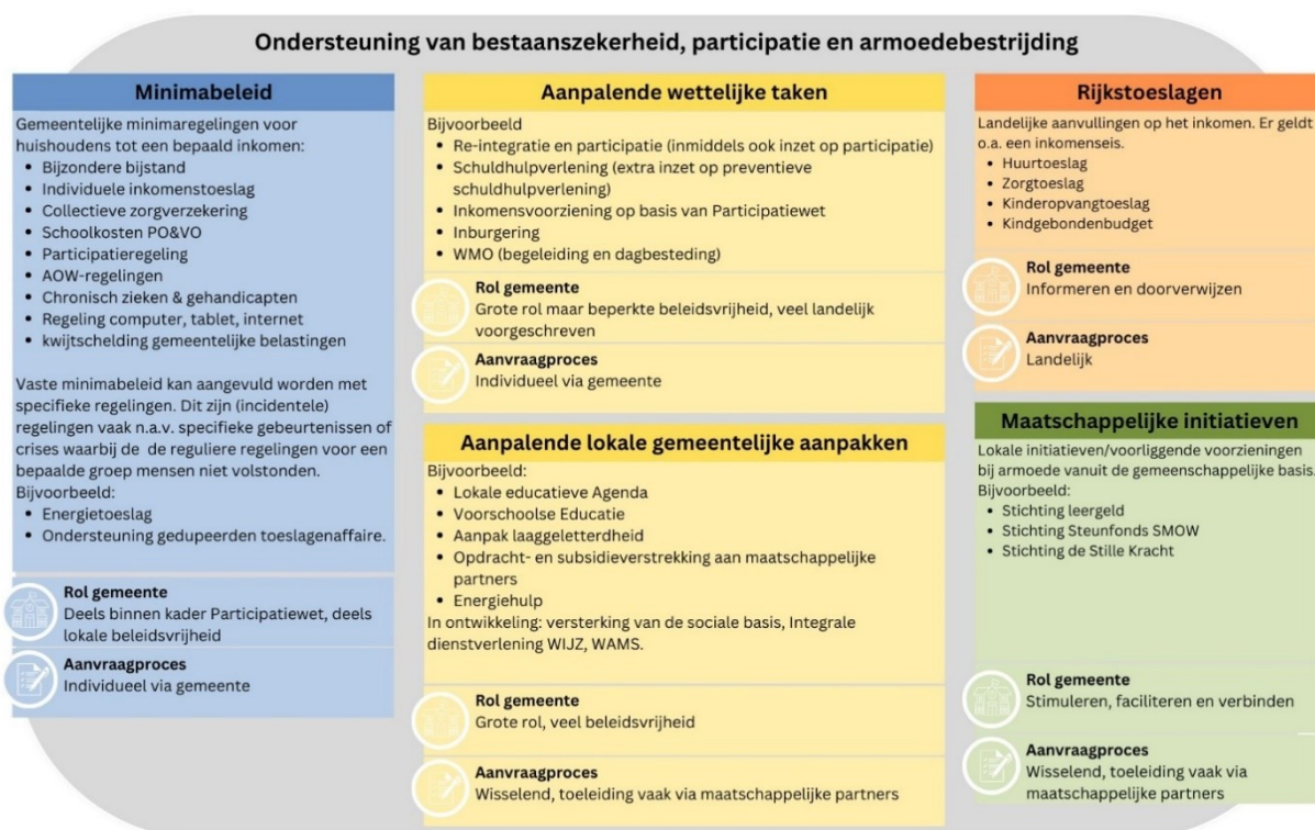
Figuur 1 Overzicht minimabeleid in bredere context

Deze regelingen zijn gericht op de individuele inwoner. De lokale regelingen zijn enerzijds bedoeld om noodzakelijke uitgaven te financieren van mensen die hiervoor geen geld kunnen reserveren (bijzondere bijstand), anderzijds om deelname in de samenleving te stimuleren (bijvoorbeeld deelname aan sociaal, culturele en sportactiviteiten). Met name dit laatste onderdeel is nauw verbonden met onze opgaven in het brede sociale domein. Naast de directe gemeentelijke inzet zijn maatschappelijke initiatieven van groot belang in de versterking van (financiële) bestaanszekerheid door de begeleiding en ondersteuning van de financiële situatie van de inwoner. In onderstaand figuur is schematisch weergegeven waar het minimabeleid zich bevindt in de bredere context van ondersteuning van (financiële) bestaanszekerheid, participatie en armoedebestrijding.