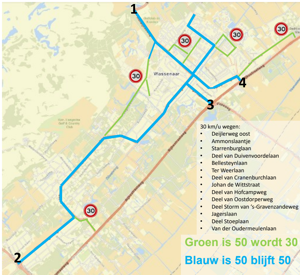
Figuur 2: overzicht aanvulling 30 km/u wegen in Wassenaar

onderzoeken van de mogelijkheid een maximumsnelheid van 30km/u binnen de volledige bebouwde kom van Wassenaar in te voeren is een motie aangenomen. (zie verderop de tekst van de motie).