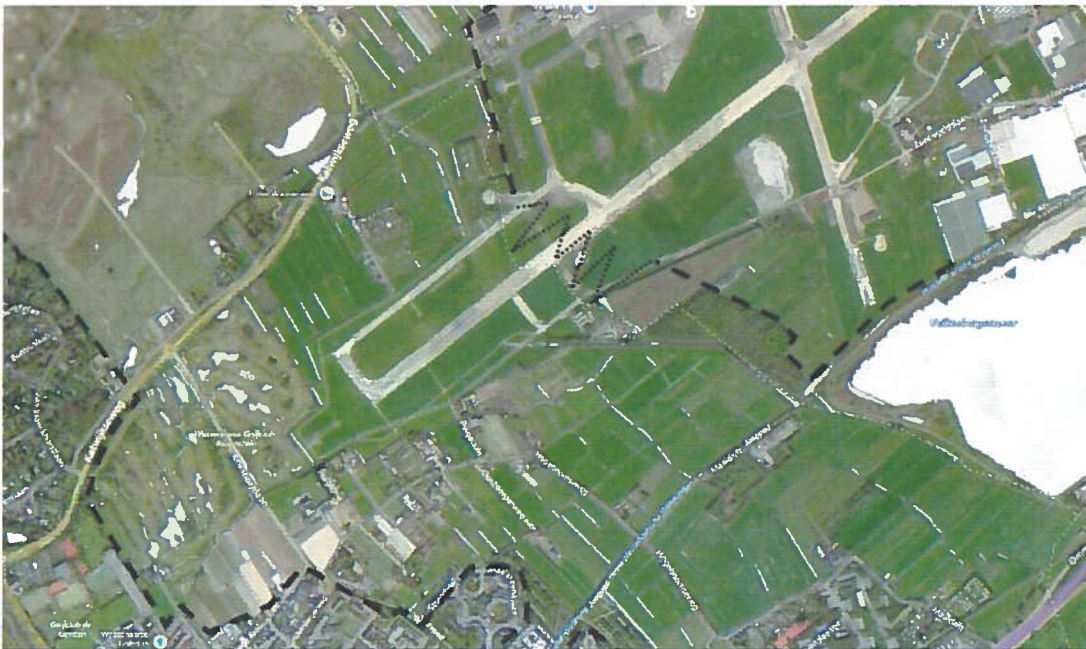
Indicatieve toekomstige begrenzing Groene Buffer