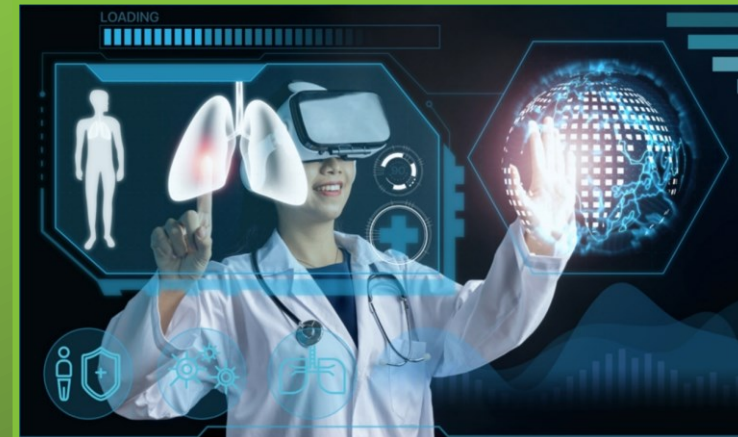
Duitsland, AI in de zorg, 2023