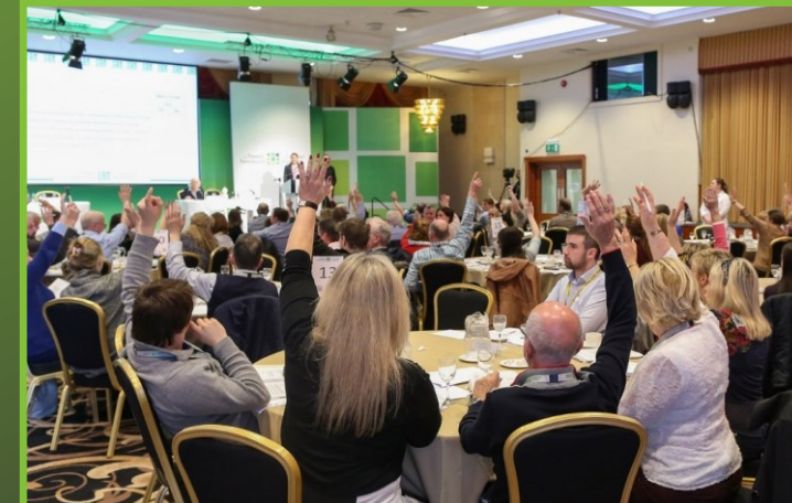
Ierland, drugsbeleid 2023