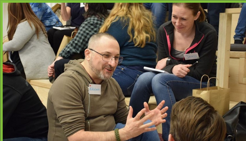
Zweden, voedsel 2023