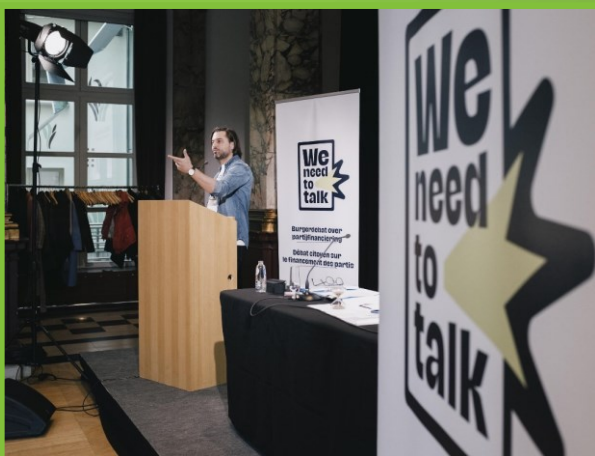
België, partijfinanciering, 2023