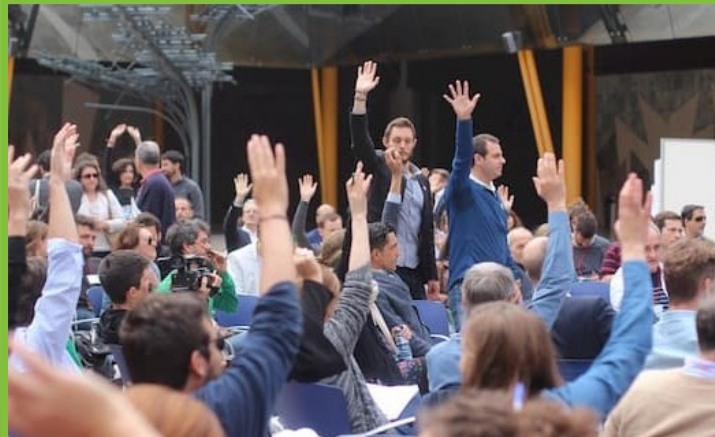
Spanje, klimaat 2022